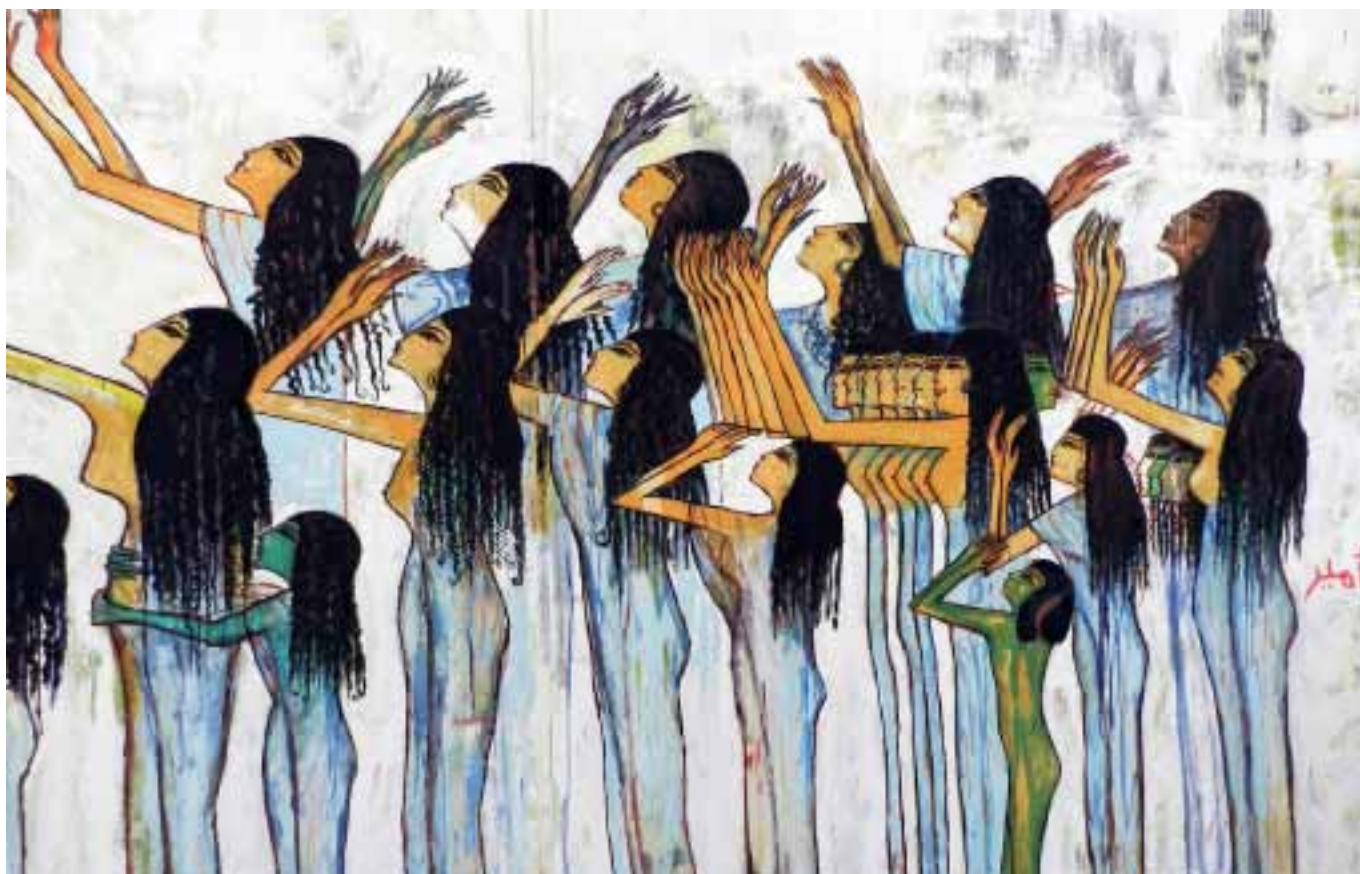
Революционное искусство на улице Мохамеда Махмуда, Каир.

Амина Араби и Юлиан Юргенмайер, Фонд Фридриха Эберта, Ливан