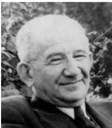
Жорж Гурвич (1894-1965), французский интеллектуал и социолог российского происхождения, один из основателей МАФС (AISLF).