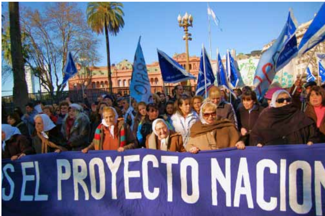
Матери Плаза де Майо, Буэнос Айрес.

Маркус С. Шульц, Университет Иллинойса, Урбана-Шампейн, США; член программного комитета МСА по подготовке Всемирного конгресса в Йокогаме, 2014