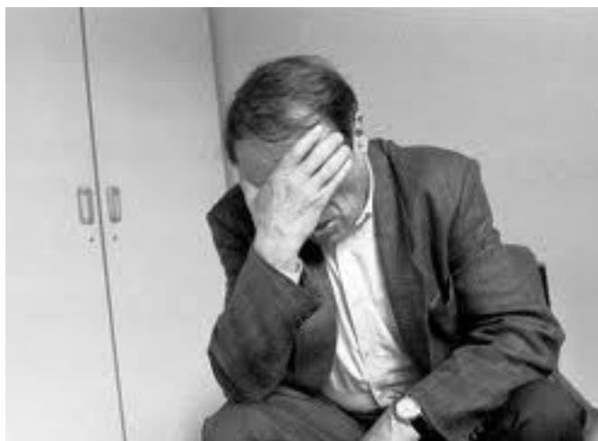
| Пьер Бурдьё — знаменитость против селебрификации.