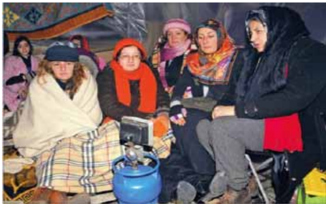
Рабочие мерзнут в палаточном городке забастовщиков, выступающих против политики найма, проводимой корпорацией TEKEL.