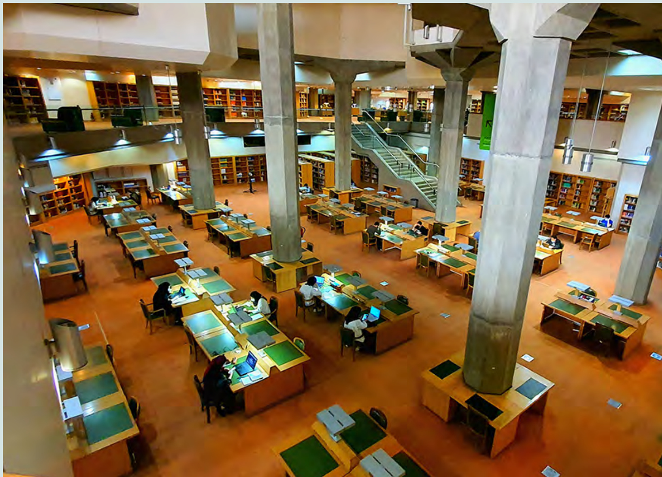
Национальная библиотека Ирана.

Наконец, доступ к самой области исследований становится все более ограниченным. Даже при наличии официальных разрешений от министерств, попытки провести наблюдения в школах, интервью или другие формы сбора данных часто сталкиваются с бюрократическими препятствиями или подозрениями. Сфера образования рассматривается как политически чувствительная область, что затрудняет проведение даже базовых эмпирических исследований. В результате исследователи часто вынуждены полагаться на документы или вторичный анализ, что ограничивает объем и глубину качественных исследований.