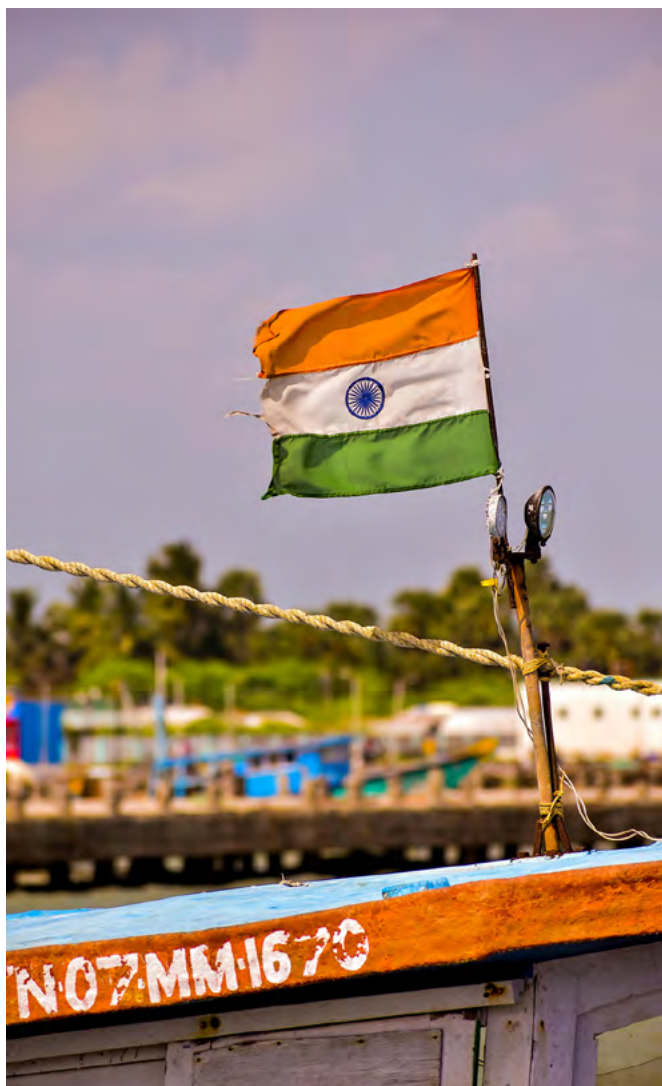
Подняв индийский флаг.