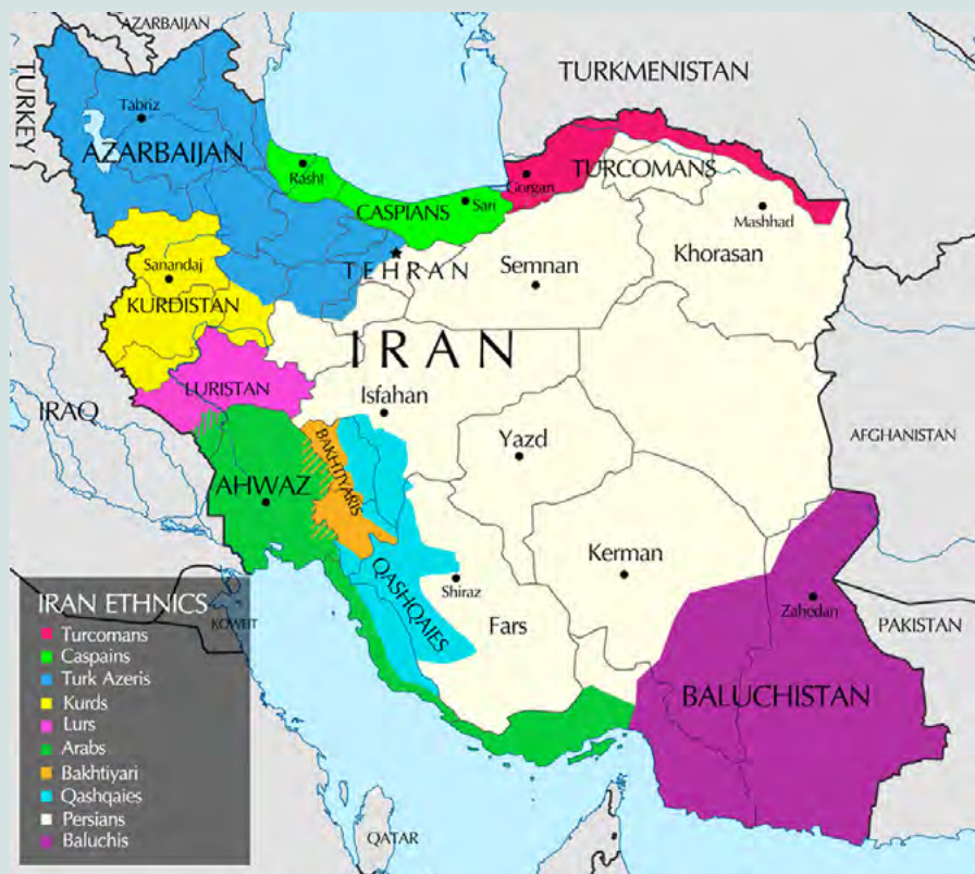
Карта этнического разнообразия Ирана, представляющая основные группы.