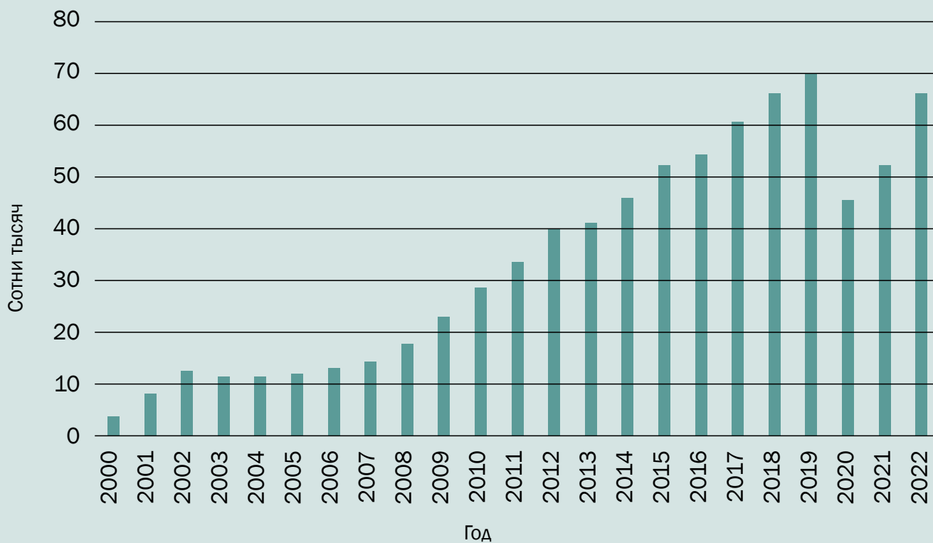
Количество китайских образовательных мигрантов за границей в 2000-2022гг.

Данные Центра Китая и глобализации, адаптированы из исследования “Развитие китайского студенчества за границей (2023-2024)”. Доступны по ссылке https://web.archive.org/web/20240514045418/http://www.ccg.org.cn/archives/84327 .