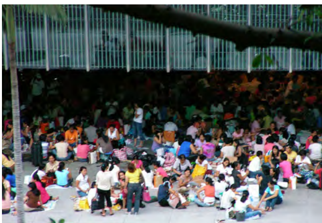
Выходной домашних работниц.

Лин Ю Лин Нг, Йоркский университет и Юньхуэй Йе, Университет Виктории (Канада)