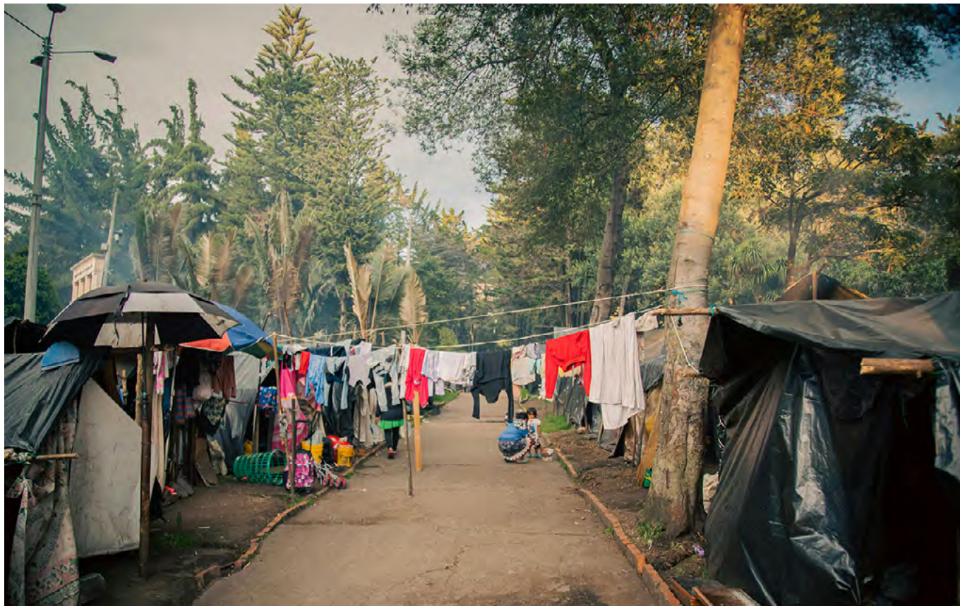
Палатки поселенцев в лесу с бельем, развешенным над тропой.