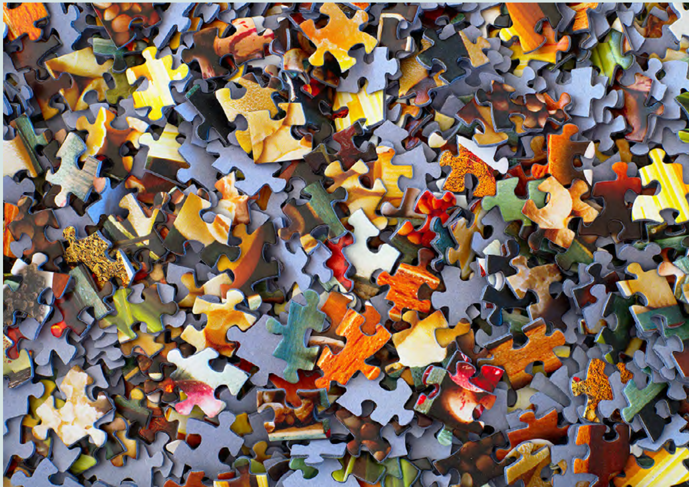
Иллюстрация Ханса-Петера Гаустера, на Unsplash.

Э тот круглый стол объединяет шестерых социологов, изучающих Иран и находящихся в различных академических областях и институциональных контекстах в разных геополитических локациях. Они все социологи, но рассматривают это общество с разных позиций, сформированных местом, которое они занимают в Иране и за его пределами, производя трансграничное знание, преодолевающее национальные, языковые и институциональные границы. Круглый стол затрагивает три ключевых методологических вопроса, исследующих вызовы, инновации и этические дилеммы проведения социологических исследований Ирана. Все авторы разделяют приверженность обоснованному, критическому и рефлексивному исследованию, хотя занимаются такими различными темами, как городской образ жизни, образовательная политика, цифровой активизм и экологическая справедливость. Каждый из них прокладывает путь по сложной территории исследования иранского общества в условиях политических и институциональных ограничений, эпистемического вытеснения и глобальной иерархии производства знаний.