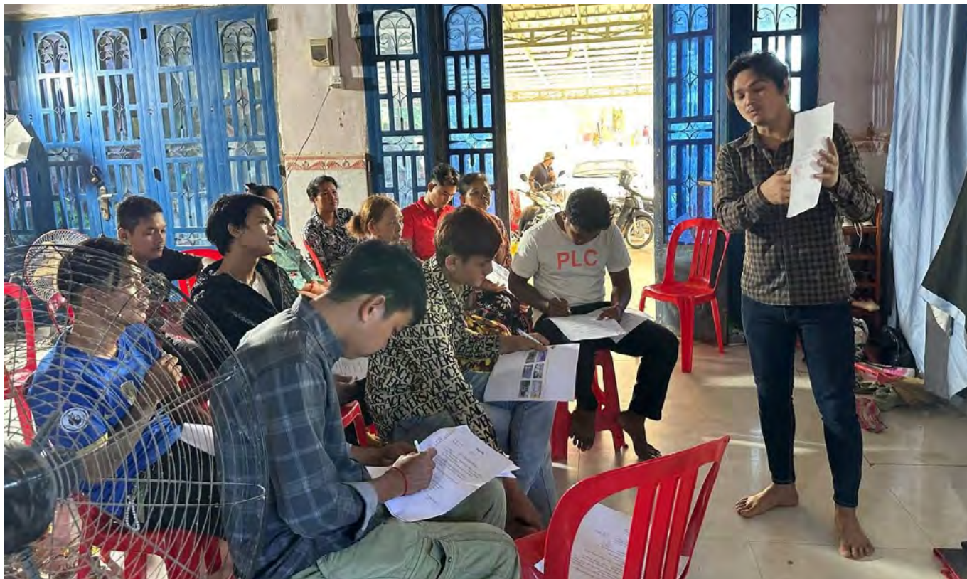
Камбоджийские сельские рабочие-мигранты на обучающей сессии по трудовым правам.

Цз Чун Лай и Какстон Сю, Гонконгский баптистский университет, Гонконг