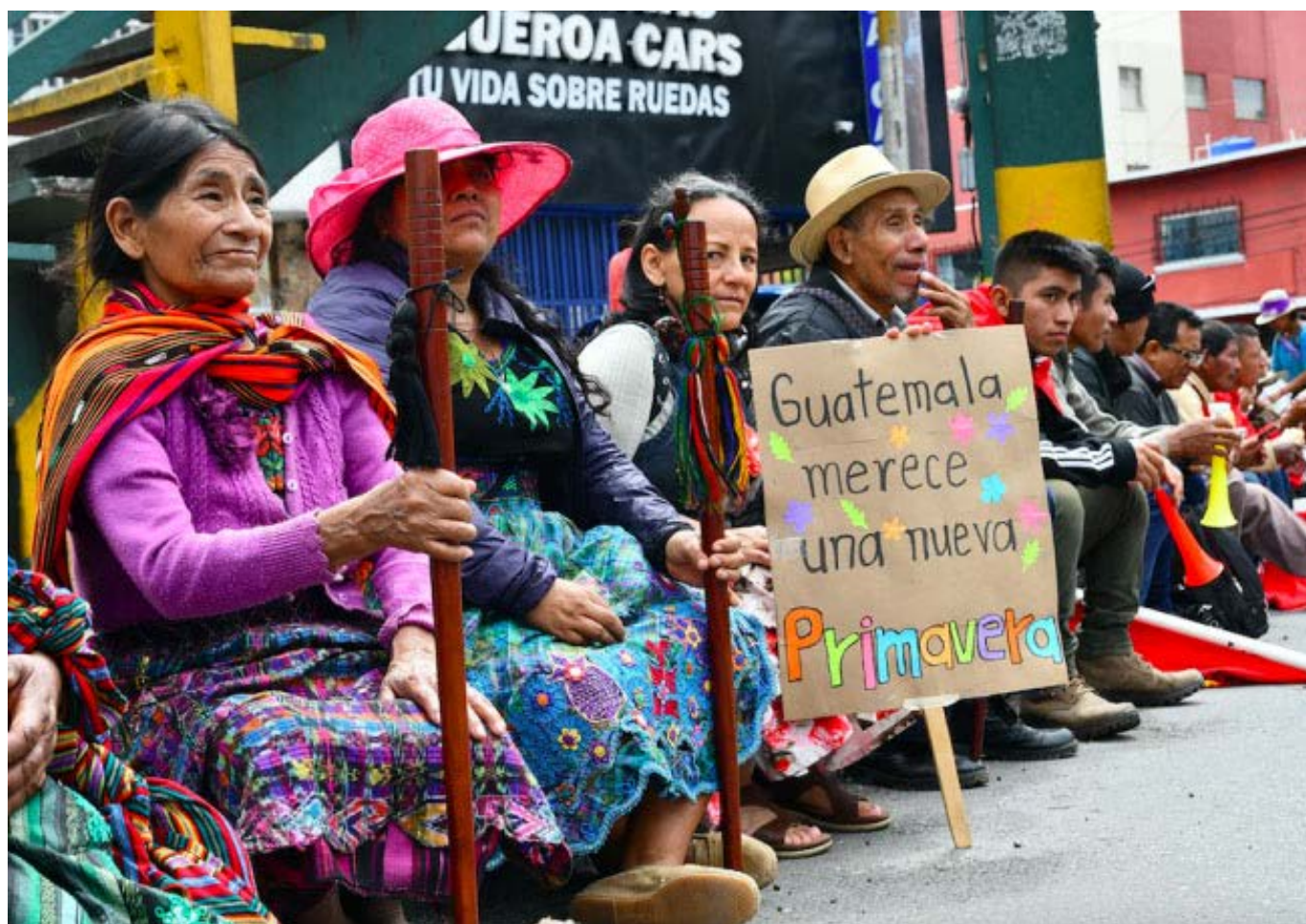
“Гватемала заслуживает новой весны”