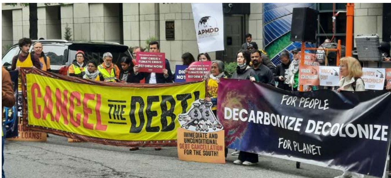
Протесты против Весенней встречи Всемирного банка, Вашингтон, Апрель 2024г.

Мириам Лэнг, Андский университет имени Симона Боливара, Эквадор