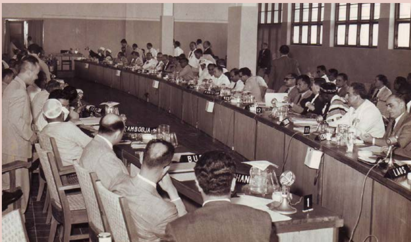
Делегации провели Пленарное заседание Экономической секции во время Азиатско-Африканской конференции в здании Мердека в Бандунге 20 апреля 1955 г.