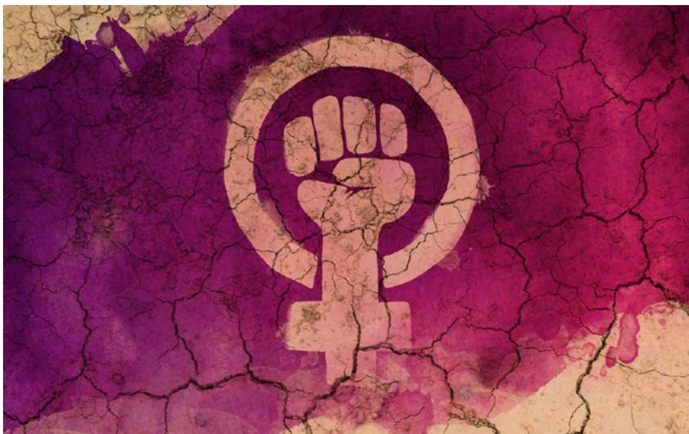
Рис.: Freerik / Адаптирован Арбу.

Зо Рандриамаро, Центр исследований и поддержки альтернатив развития – Индийский океан, Мадагаскар