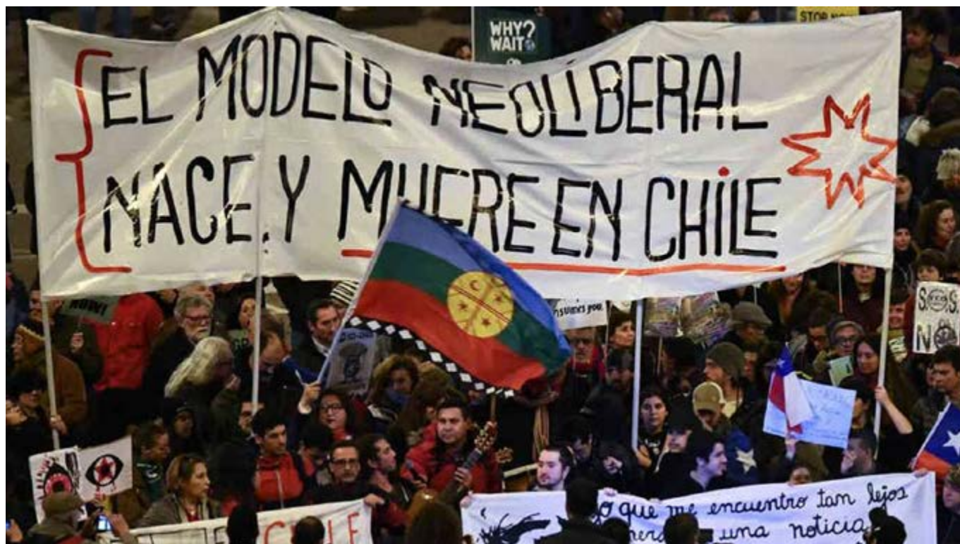
“Неолиберальная модель родилась и умрет в Чили”.