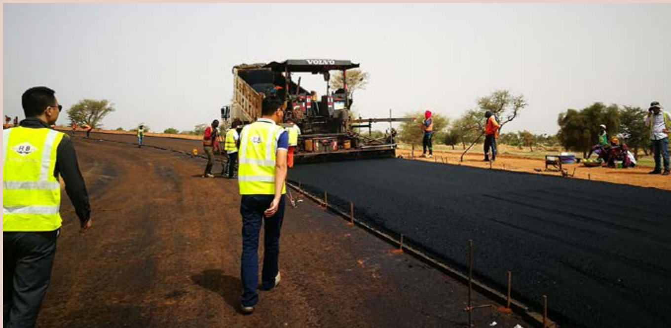
Строительство шоссе ILA Tours Китайской дорожно-мостовой корпорацией (CRBC) в Тиесе, Сенегал.

Эрик Цезне, Университет Утрехта и Роос Виссер, Университет Амстердама (Нидерланды)