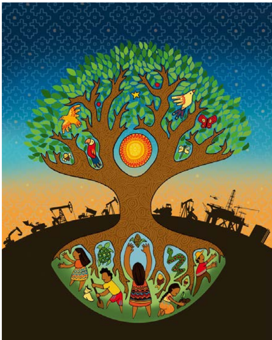
Рис.: Angie Vanessita (angievanessita.wordpress.com) .

С тремясь к социально-экологической справедливости и опираясь на принципы народного экологизма, мы отстаиваем справедливый и народный энергетический переход, основанный на антикапиталистическом и социально-экологическом нарративе. Однако для этого мы должны сначала провести диагностику текущей ситуации и наметить путь к желаемому будущему. Важно понять масштабы изменений, необходимых для решения проблем, связанных с энергетикой. Это подразумевает учет не только выбросов парниковых газов, но и социального неравенства и социаль-