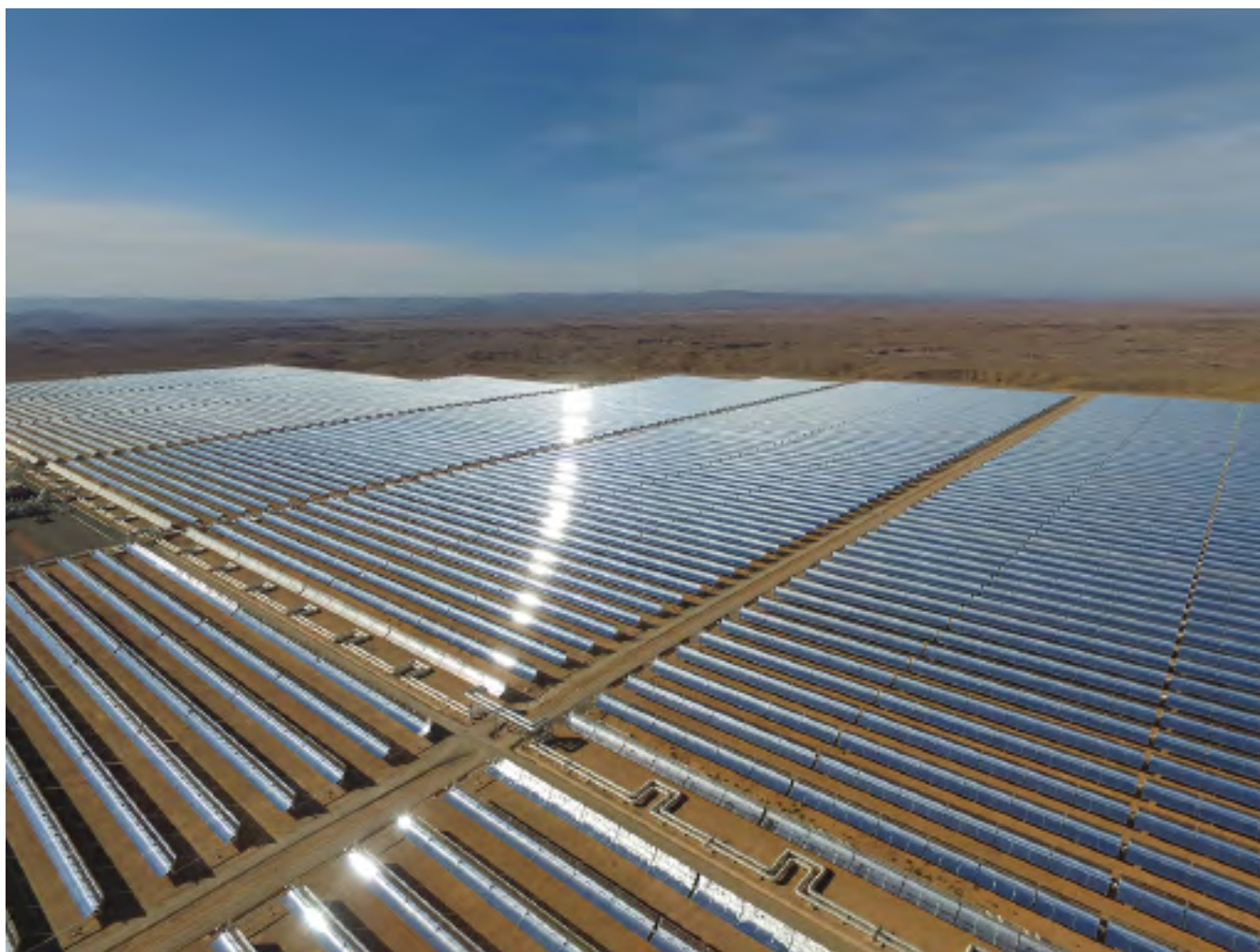
Centrala solara Ouarzazate, Maroc.