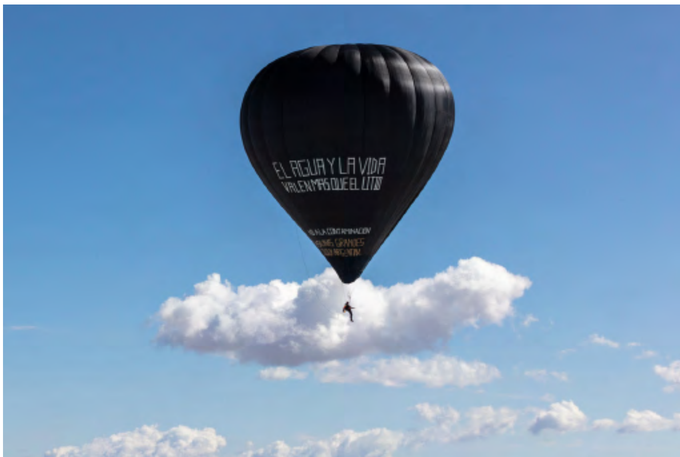
Zburați cu Aerocene Pacha (Salinas Grandes și Bazinul Laguna de Guayatayoc, Jujuy, Argentina, 2020).