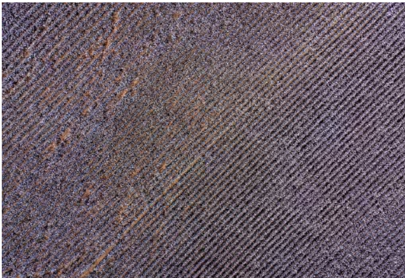
| Plantație de bumbac.

de Gurminder K. Bhambra , Universitatea din Sussex, Marea Britanie