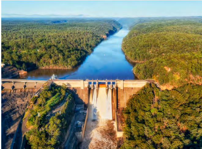
Barajul Warragamba.

de Madelaine Moore , Univesitstea Bielefeld, Germania