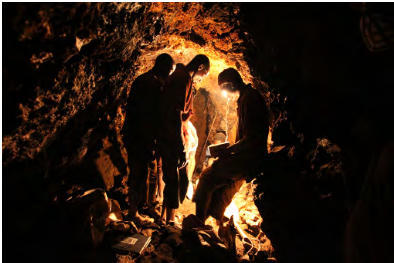
Mineritul în Africa.

de Nnimmo Bassey , Health of Mother Earth Foundation, Nigeria