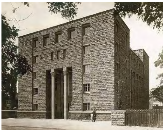
Institutul de Cercetare Socială, Frankfurt, în anii 1920.