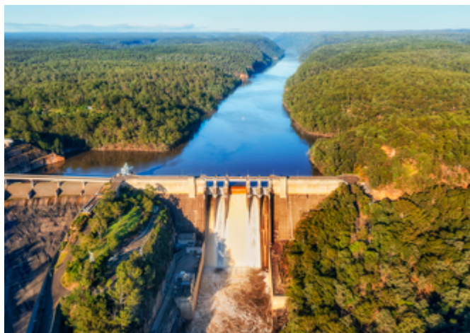
Плотина Варраганба.