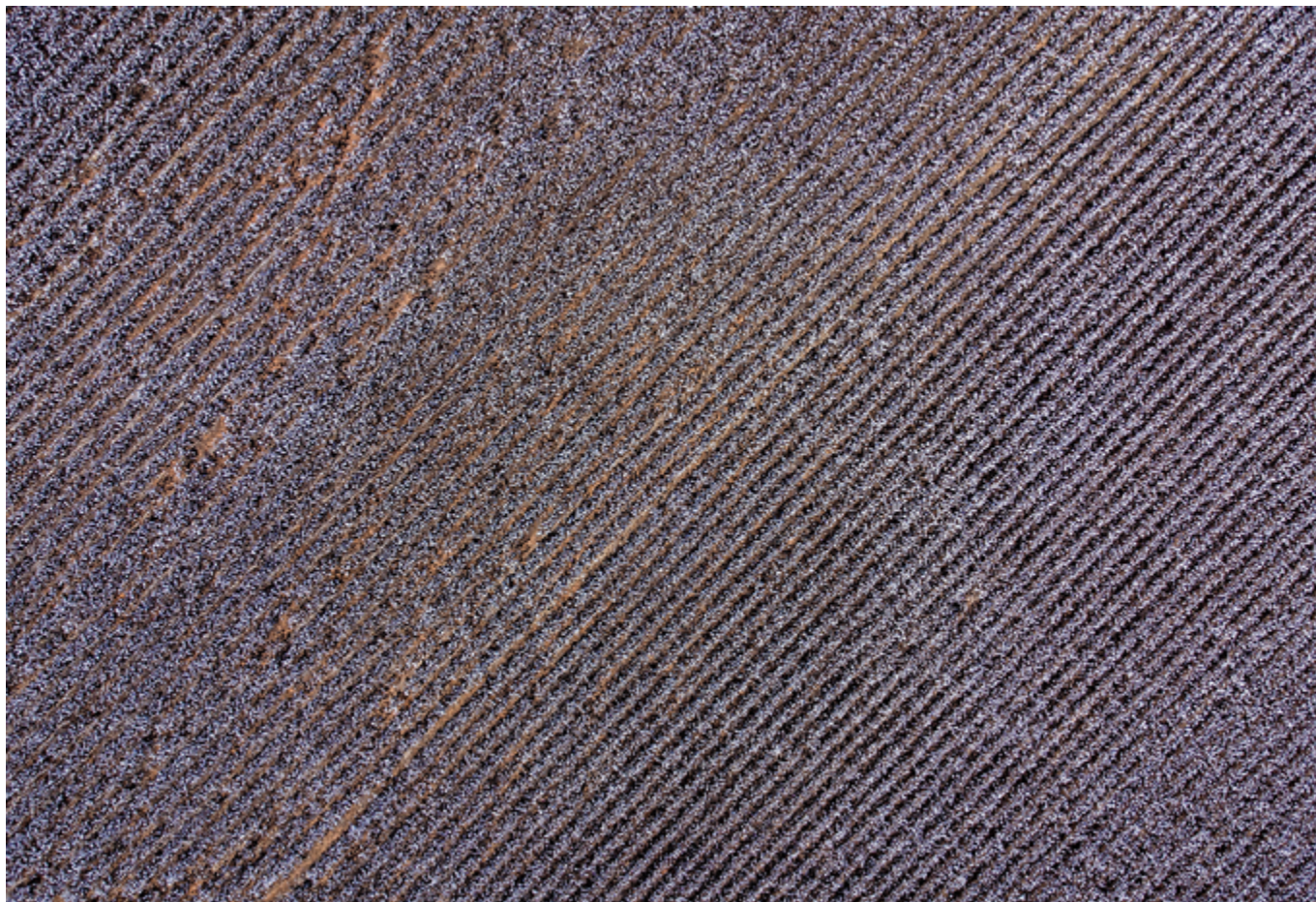
Хлопковая плантация.