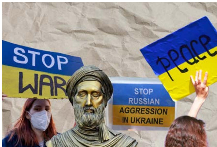
Рис.: фотомонтаж Витории Гонсалес, 2023.

Ахмед М. Абозайд, Университет Саутхэмптона, ВБ