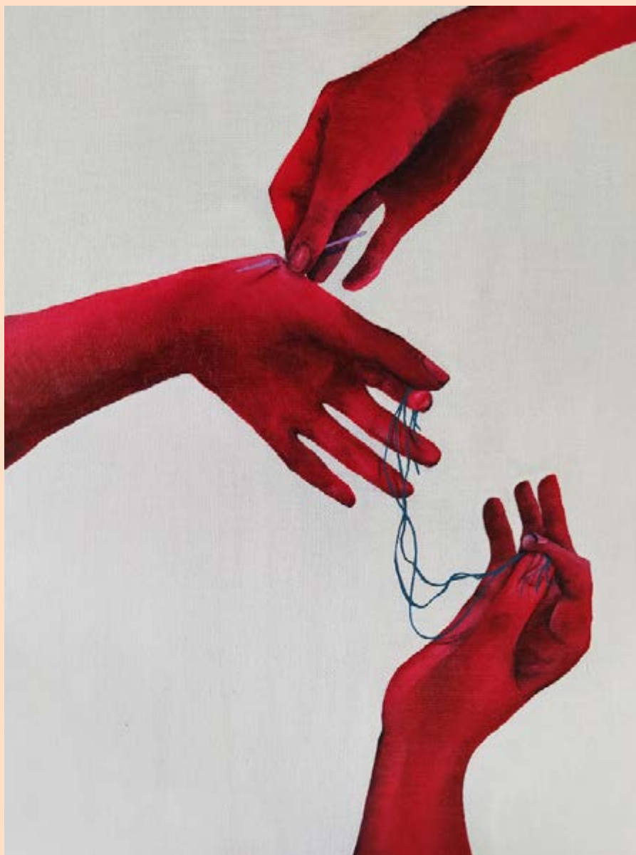
Холст, масло и акрил. Рис.: Бела Риги ( instagram.com/belafrighi ), 2020.

Азми Бишара, Арабский центр исследований политики, Катар