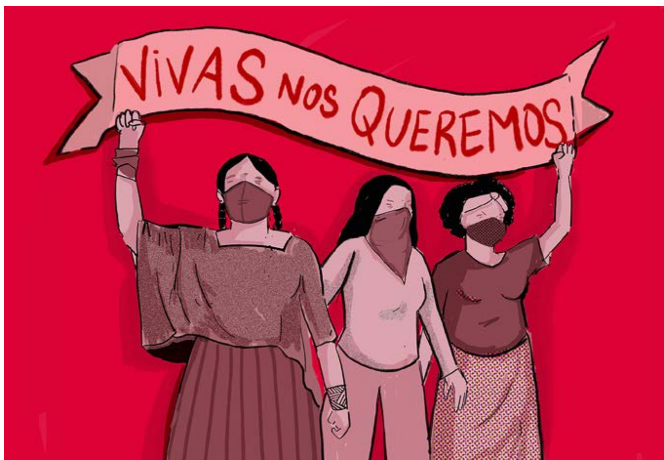
Фото: Иллюстрация «мы хотим быть живыми» бразильского художника и политического ученого Рибса ( twitter.com/o_ribs и instagram.com/o_ribs ) для Обсерватории общественных движений Центра социальной теории и латиноамериканских исследований (NETSAL-IESP/UERJ). Рибс, 2021.

Приядаршини Бхаттачариа, административный офис правительства Индии, Индия