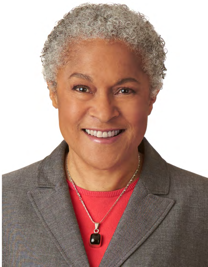
Patricia Hill Collins.