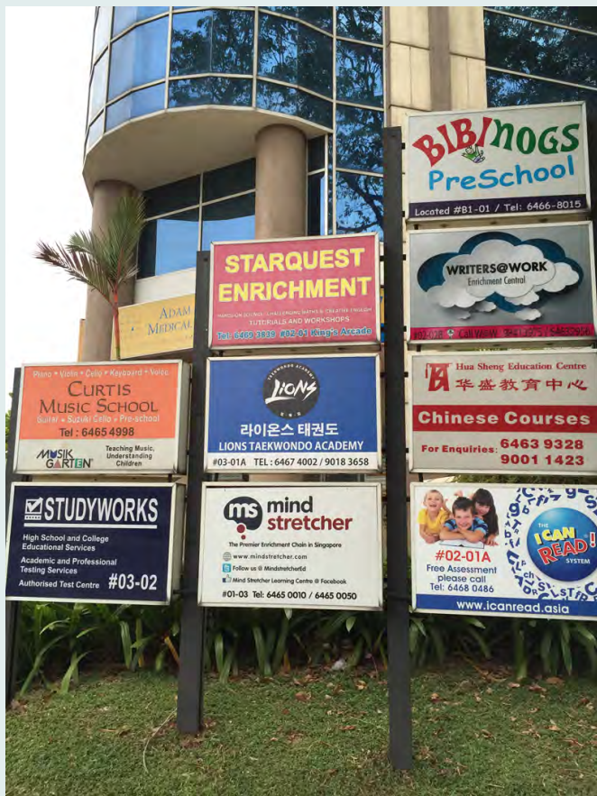
当代新加坡越来越常见这种“特别加强”和“小班教学”的广告。

Youyenn Teo, Nanyang Technological University, 新加坡