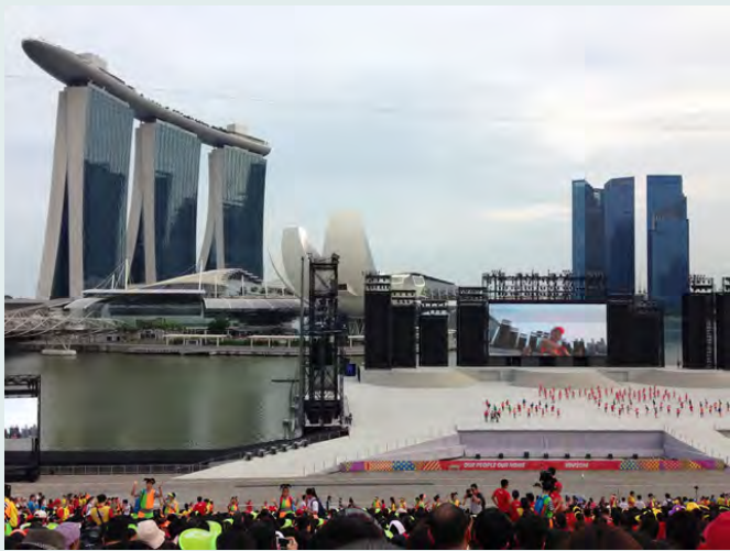
滨海湾的国家的国庆游行彩排，有个漂浮的舞台