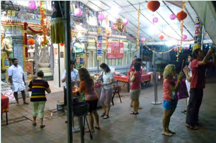
观音寺庙的华人在掷交抽籤，在南兴都庙附近。

Vineeta Sinha, National University of Singapore, ISA出版副会长, 2014-2018