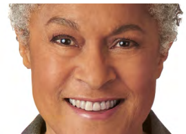
Patricia Hill Collins 是顶尖的非裔美国女性主义者，这期谈论其知识和根源和边缘化。