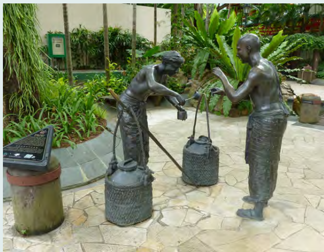
在Telok Ayer历史遗迹的马来和印度雕像，为于新加坡的华人城区。