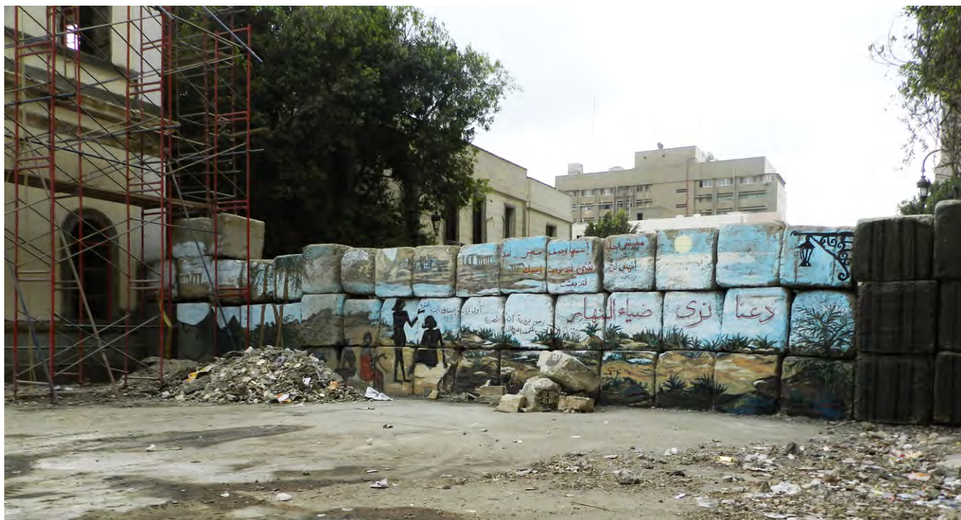
Kasr al Aini牆，被移掉且置換上了一扇門。Alaa Awad塗鴉。2012年12月7日。