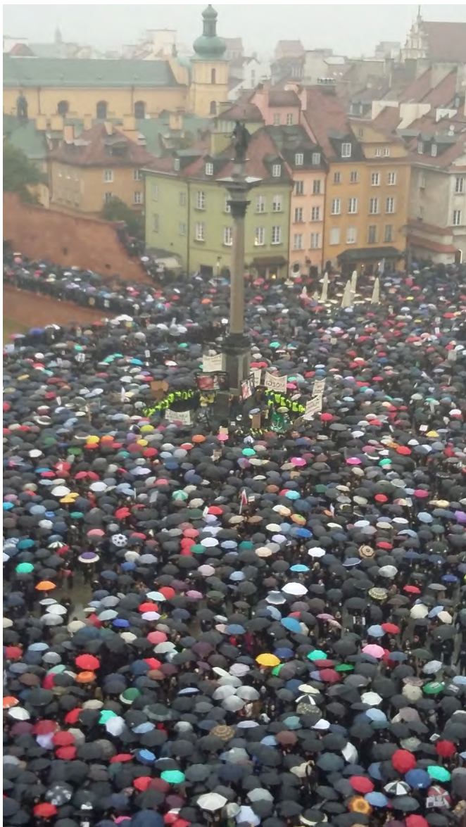
波兰女性在Warsaw抗议新的堕胎法案。2016年10月3日。

在2016年的秋天，有一波女性的抗议爆发了，目的是为了反接下来可能要把堕胎入罪化的行动。波兰女性主义从1993年就开始抵抗反堕胎法案，而波兰的法律是欧盟里面最严格的，只让乱伦、强暴、危害健康性命、胚胎基因变异的案例下可以堕胎。