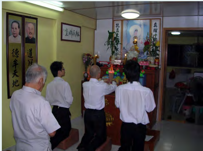
在一个公共住宅内的家庭寺庙的信徒。

Francis Khek Gee Lim, Nanyang Technological University, 新加坡