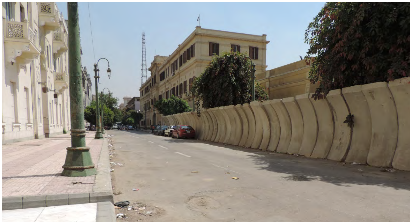
新建立的牆，就在開羅American University的大門前面。2015年9月21日。

似乎意味着旧政权的政治和经济精英的复辟。在2011年1月之后，人们见识到了匪徒治国（即使这是旧政权时代的匪徒）带来的犯罪和暴力。上千名的小贩商家占据了所有可能的空间，包括各种角落、街道、桥上，然后阻碍的交通。对于中产阶级来说，这是可怕的“失序”。但是，这其实告诉我们的是：许多年自由主义的失败，造成了当时的这幅景象。