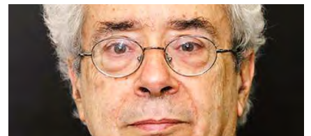
Luc Boltanski 是杰出的法国社会学理论家，这期讨论侦探小说和对社会学的重要性。