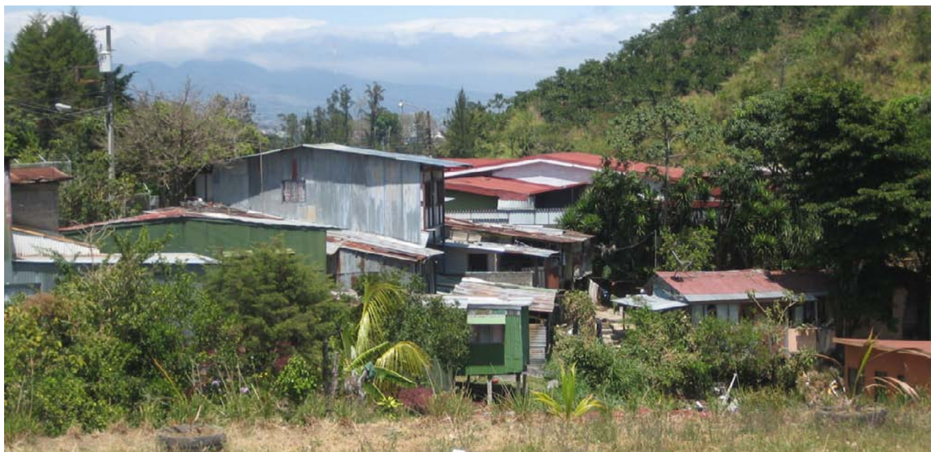
Рискованные условия жизни в Коста-Рике.