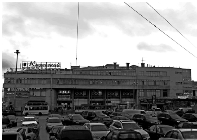
Фото 5: Фабрика-кухня