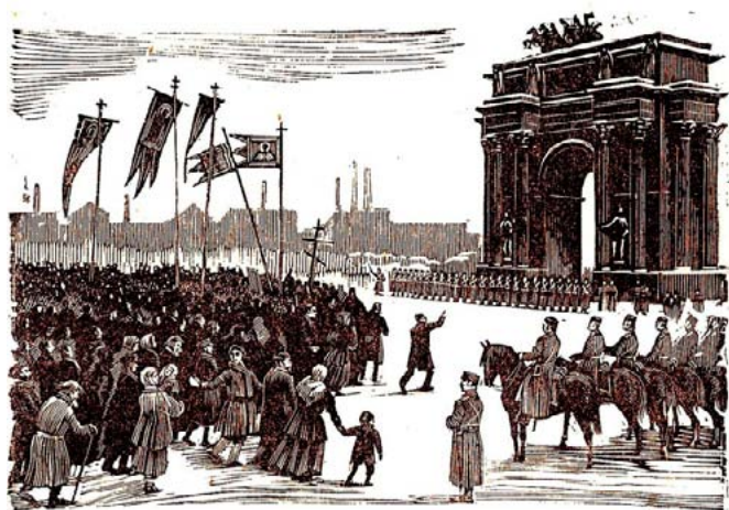
Фото 1: Демонстрация рабочих у Нарвских ворот перед Кровавым воскресеньем 1905 года под наблюдением вооруженной царской гвардии. Неизвестный художник.