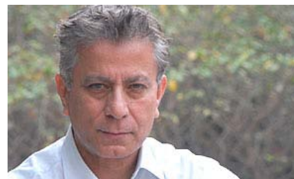
Дипанкар Гупта , выдающийся индийский социолог и публичный интеллектуал, исследует связь между социальными науками и демократией.