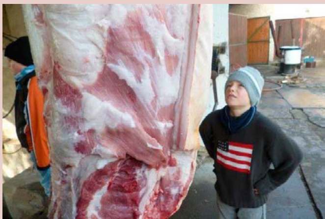
Урок анатомии на дому!

Ирена Каспарова, Университет имени Масарика г. Брно, Чешская Республика