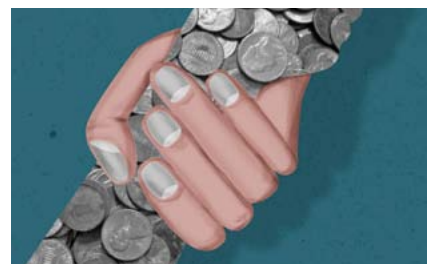
Бригитте Ауленбахер , ведущий австрийский социолог, собирает отчеты об исследованиях заботы во всем мире.