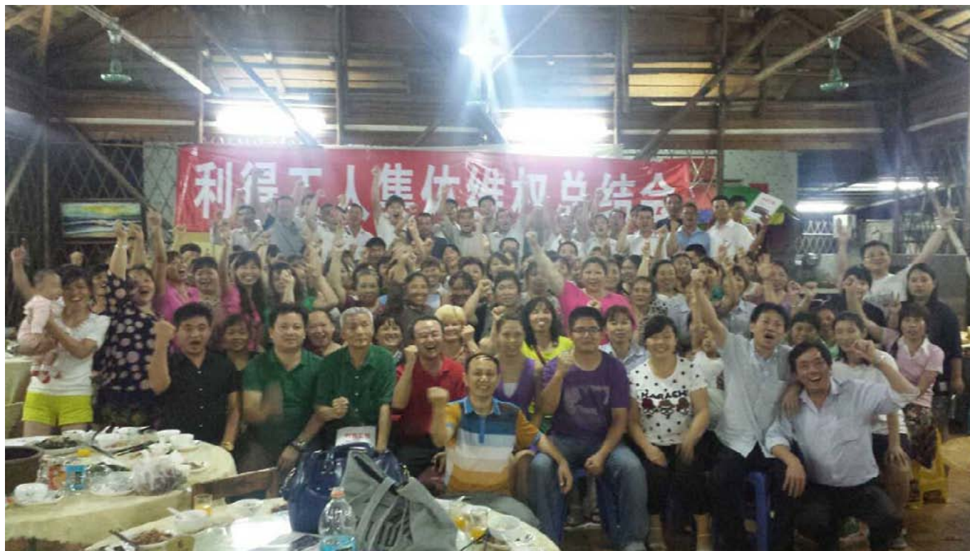
Активисты НКО и рабочие отмечают успешное завершение переговоров в Гуаньчжоу.

Лифень Лин, Университет штата Висконсин, Мэдисон, США