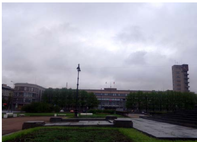
Фото 6: Здание Кировского райсовета