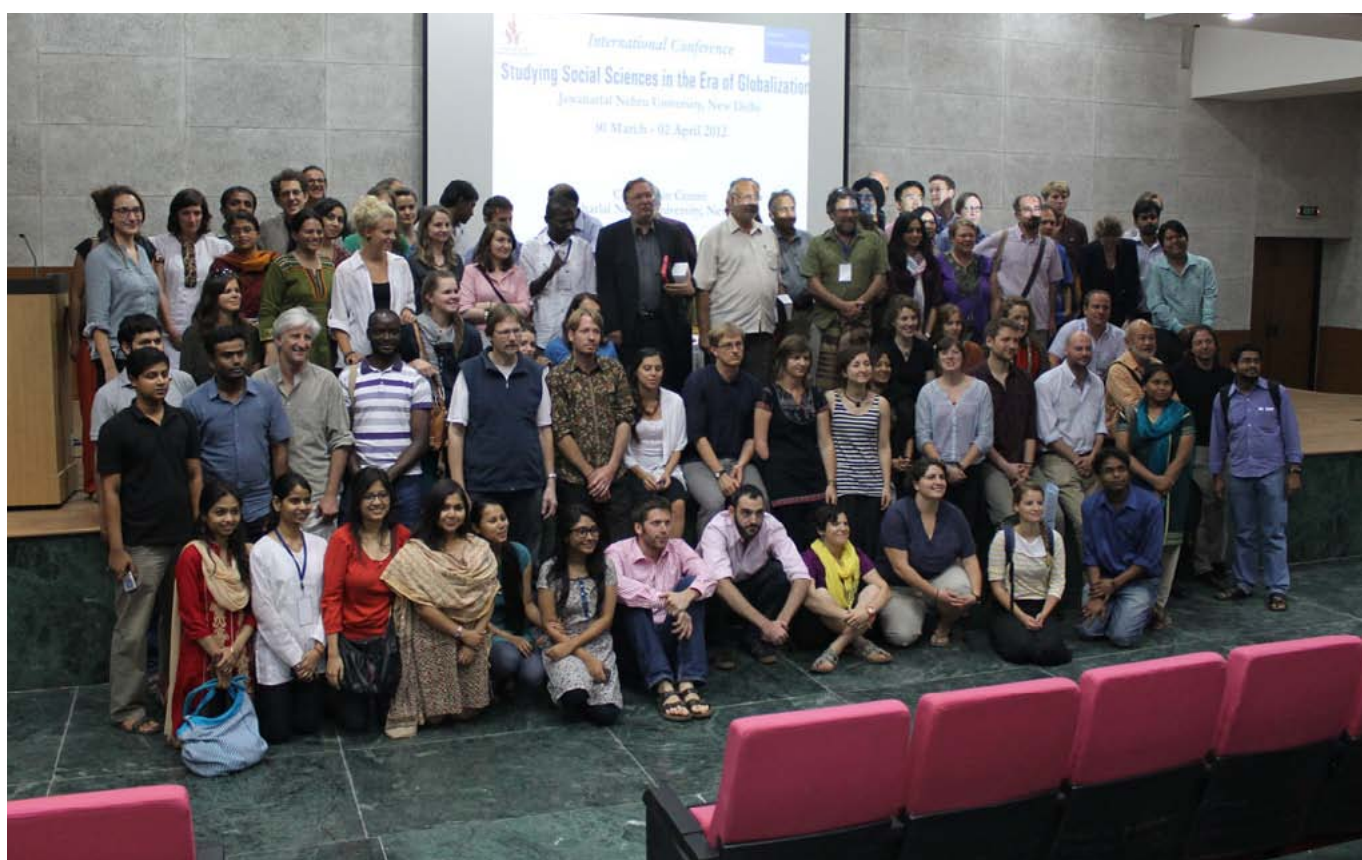
Участники программы «Глобальные исследования» университета Джавахарлала Неру, Нью-Дели.

Эрджюмент Челик , Фрайбургский университет, Германия, Член правления Исследовательского комитета МСА по рабочему движению (ИК 44) и ИК по общественным движениям, коллективному действию и социальным изменениям (ИК 48).