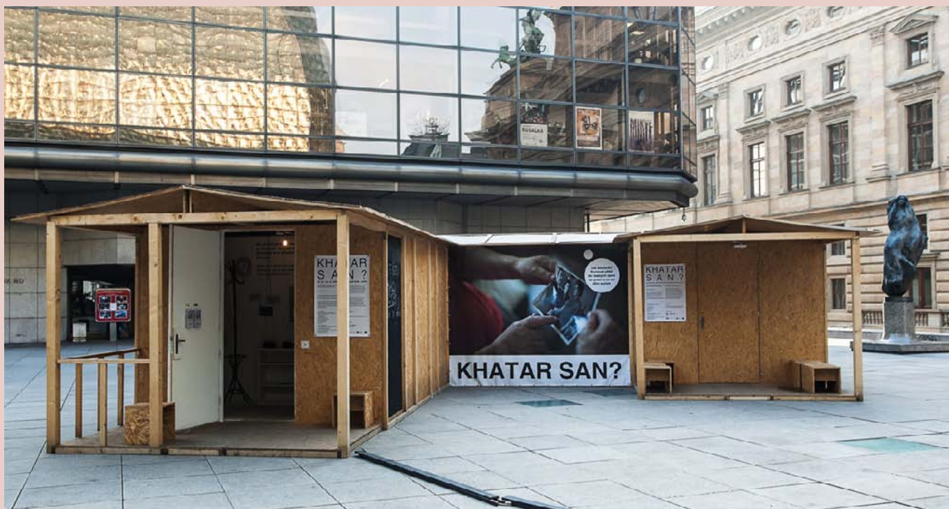
Выставка о цыганах рома на площади Национального театра в Праге.