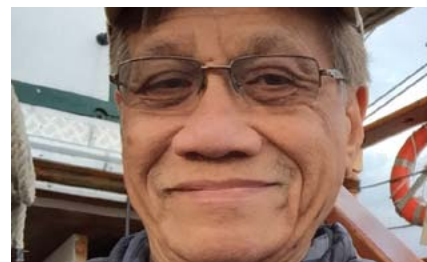
Уолден Белло , всемирно известный филиппинский социолог, размышляет о вызовах и разочарованиях, которые ему принесла политическая карьера, и объясняет, почему он ушел из парламента.

> «Глобальный диалог» выходит на 16 языках на сайте МСА . > Присылайте статьи на адрес burawoy@berkeley.edu