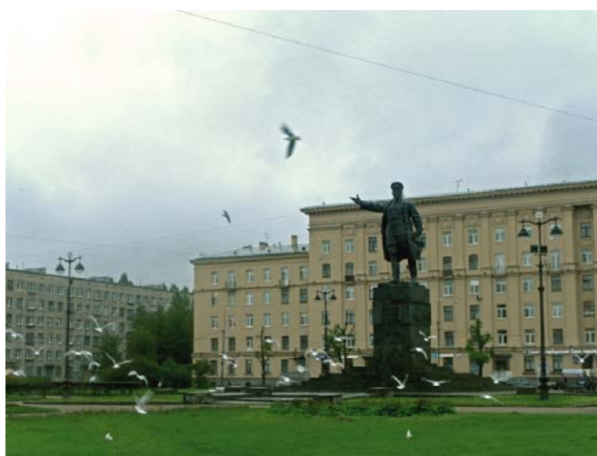
Фото 8: Сталинская архитектура на Нарвской площади (площади Стачек).