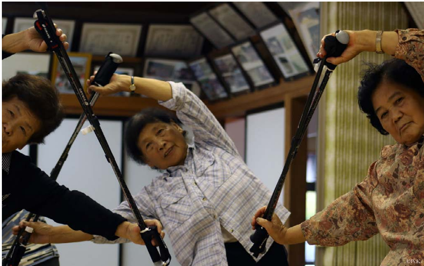
Активное старение в Японии.

Хильдегард Теобальд , Университет Фехта, Германия, член научно-исследовательских комитетов МСА по проблемам старения (ИК11) и бедности, социального обеспечения и социальной политики (ИК19) и Яей Сайто , Университет Осаки, Япония