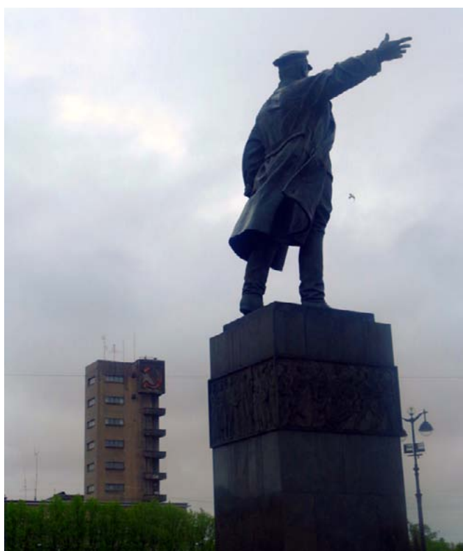
Фото 7: Памятник Сергею Кирову