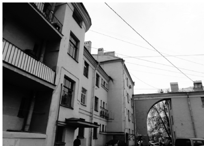
Фото 2: Жилые дома на Тракторной улице.