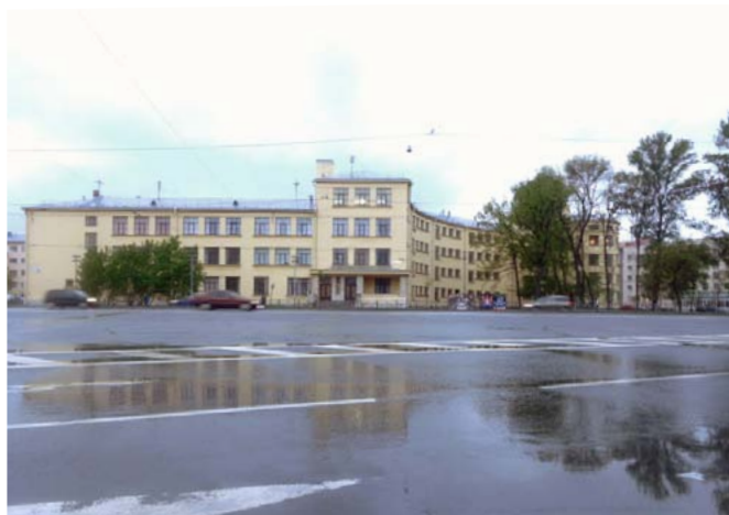
Фото 3: Школа имени 10-летия Октября