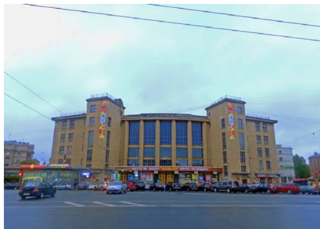
Фото 4: Дом Культуры