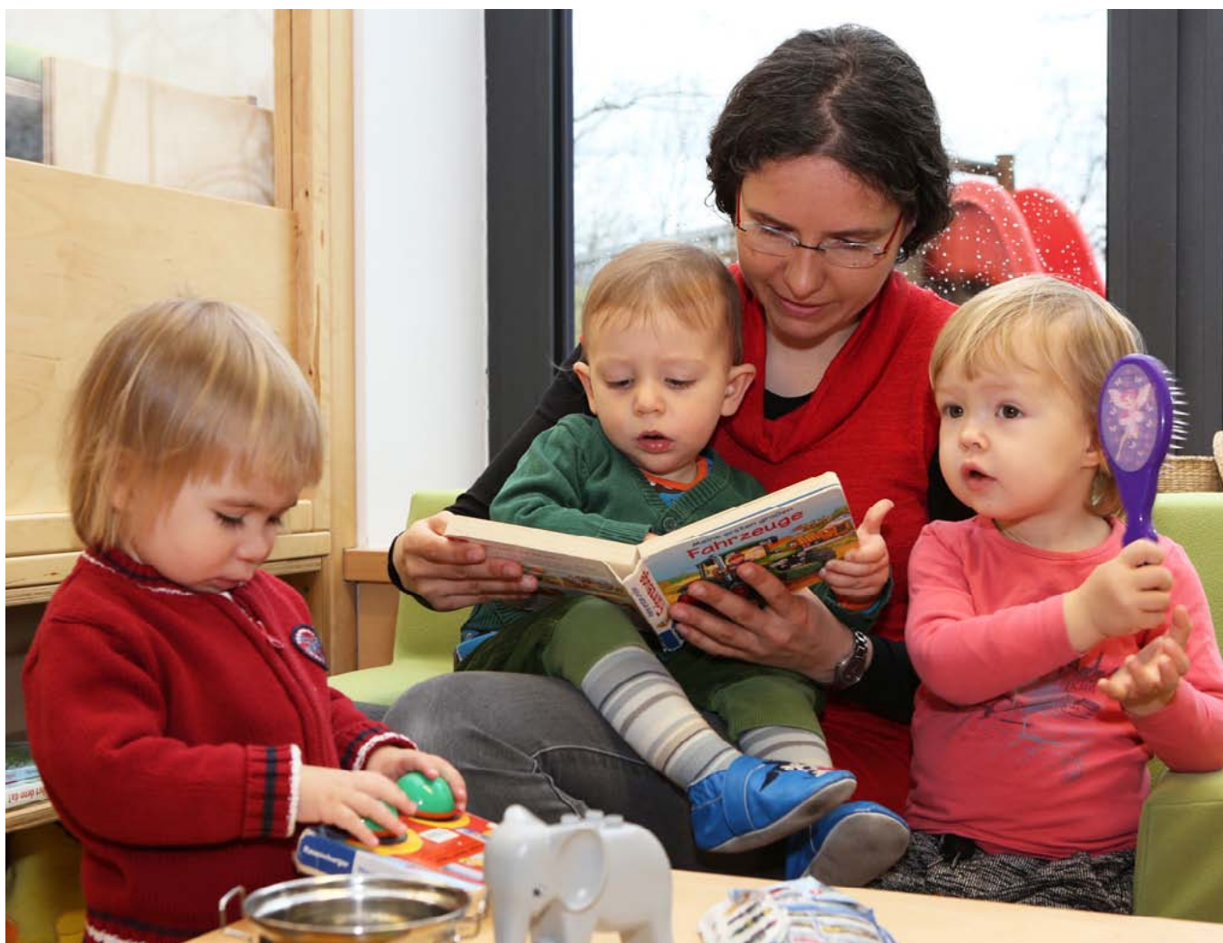
Типичный австрийский детский сад.