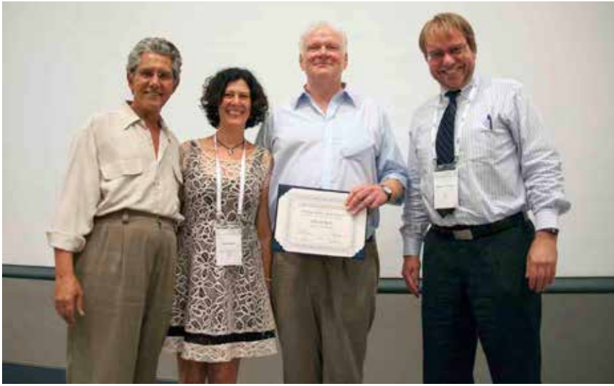
Ulrich Beck 2014 yılında Uluslararası Sosyoloji Derneğinin Gelecek Araştırmalar Komitesi'nden (RC07) Gelecek Araştırmalarına En Değerli Katkı İçin Yaşam Boyu Başarı Ödülü'nü alırken.