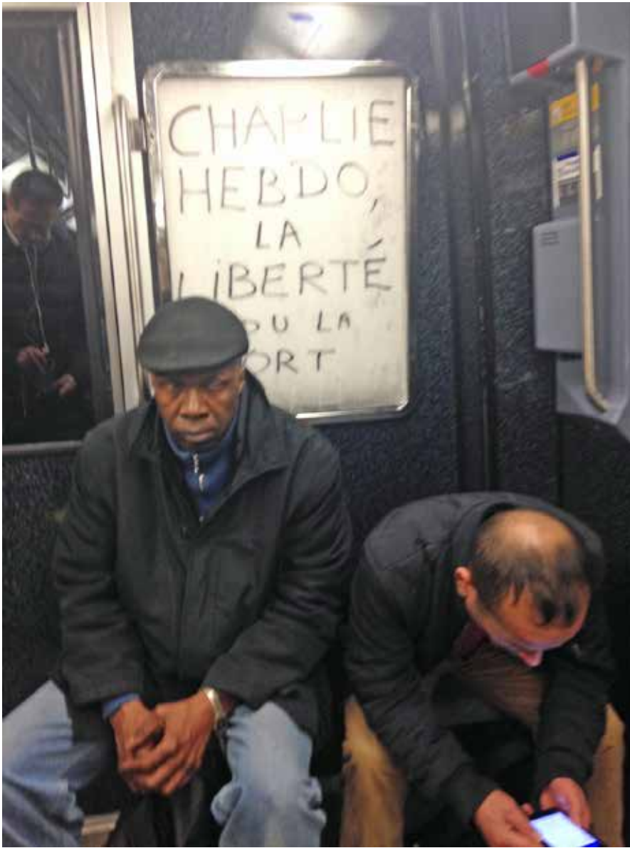
Paris Metrosu, 12 Ocak, 2015.