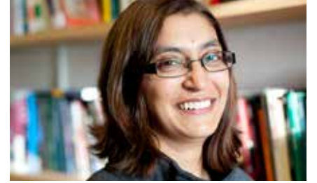
Öncü İngiliz sosyolog Gurminder Bhambra küresel sosyolojiye dair geleneksel yaklaşımları eleştiriyor, ve “bağlantılı sosyolojiler” yaklaşımını sunuyor.