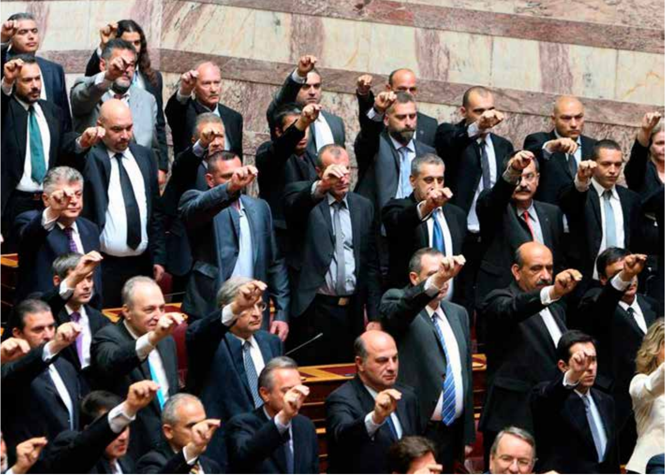
Yunan Parlamentosundaki neo-Nazi Altın Şafak hareketi

2012 Baharı bir dönüm noktasıydı, Eric Hobsbawn'dan ödünç alırsak, "kızgın halkların baharının" ortaya çıkışıydı. Avrupa siyaseti hızlanıyor gibi görünüyordu: bir seçim hüsrani diğerini izledi. Aşırı sağ ve sol seçimlerde yol katetmeye başladılar. François Hollande Fransa'nın başkanlık seçimlerini kazandı, fakat Marine Le Pen de üçüncü oldu. Aşırı sağ ve sol, toplamda, görevdeki başkan Sarkozy ve Sosyalist rakibinden daha fazla oy aldılar.