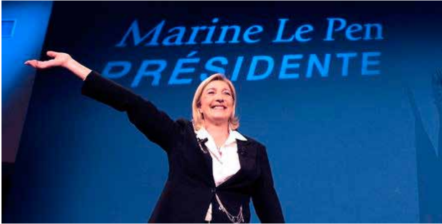
Marine Le Pen, gelecek başkan adayı.