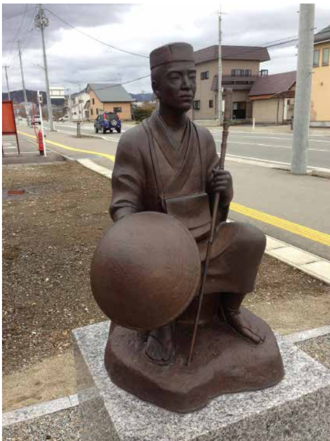
O statuie a lui Basho Matsuo lângă o stradă din orașul Higashine, prefectura Yamagata, care era una dintre rutele sale din Hiraizumi unde a scris fimosul haiku despre efemeritatea gloriei umane.