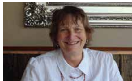
Raewyn Connell , feministă australiană și autoare de teorii sudice, privește sociologul ca pe un participant al unui proces de muncă global, organizat ierarhic, care este mai departe distorsionat de invazia pieței de campusuri.