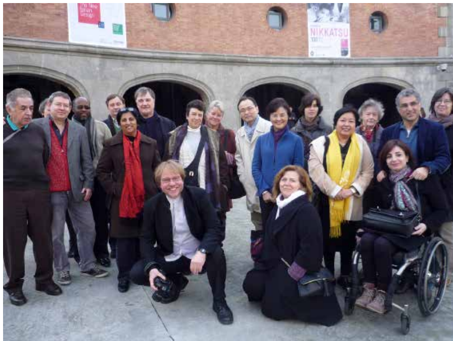
Comitetul Executiv al ISA, întâlnire în Bilbao, făcând un tur al orașului.