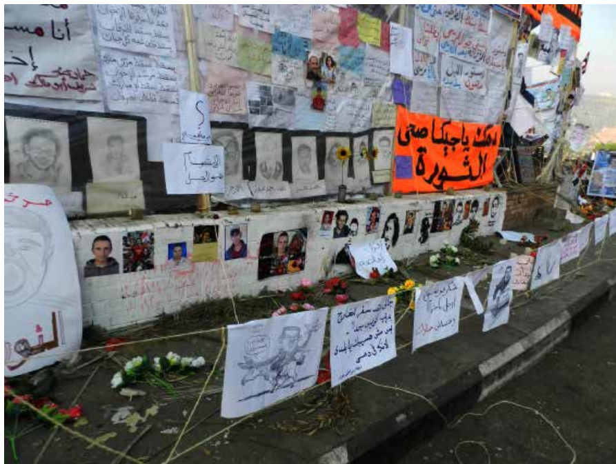
Muzeul Deschis al Revoluției, reprezentând martirii săi în centrul Pieței Tahrir. Muzeul a fost replicat la palatul prezidențial din Heliopolis. Tahrir a fost percheziționat de poliție în mai multe rânduri și Muzeul a dispărut.