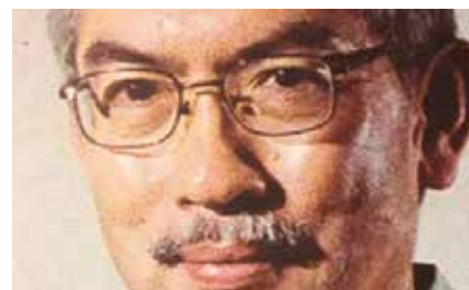
Randolf David , sociolog filipinez de mare renume, descrie o viață de angajament critic dedicat transmiterii sociologiei în sfera publică și arată cum aceasta diferă de angajamentul politic.