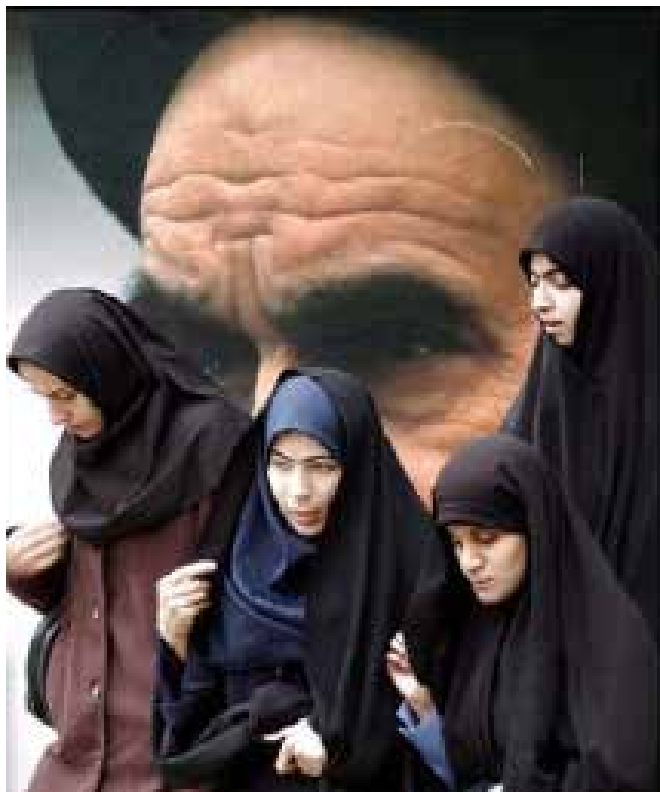
Femei în umbra liderului suprem din Iran, Ayatollah Khomeini.