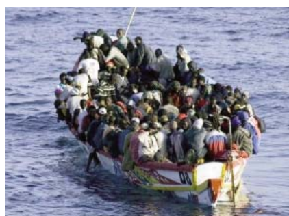
Trata de personas.

En las sesiones plenarias se discutió la evaluación de la delincuencia organizada, que debe ser supervisada por sus pares seleccionados a nivel internacional y apoyada en datos. La mayoría de los países tenían prisa por implementar la evaluación y para mostrar las actividades y logros concretos, otros se mostraban rea-