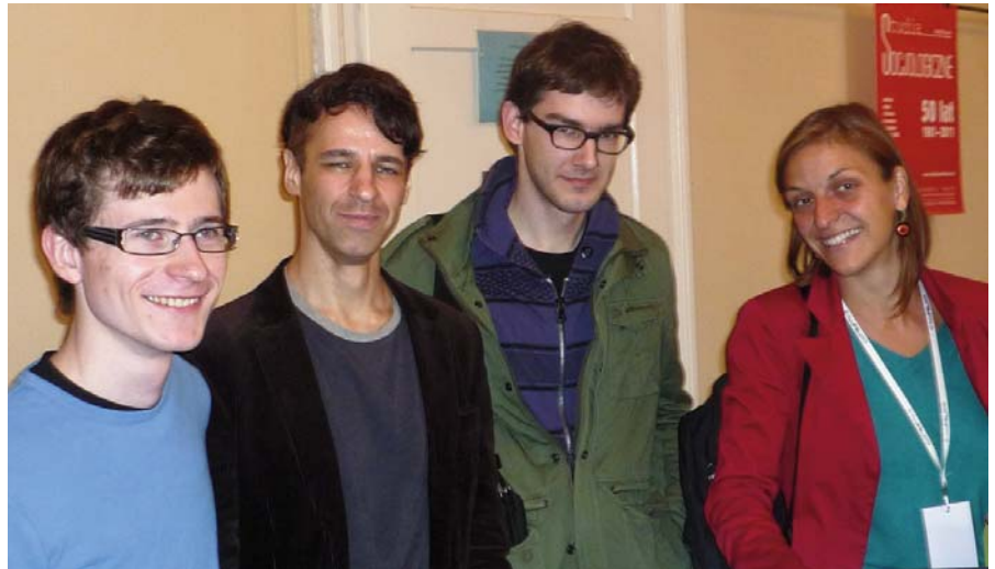
Jóvenes sociólogos y sociólogas en la reciente reunión de la Asociación Polaca de Sociología.

El mayor proyecto liderado por la Sección durante los últimos tres años es "Movilizando seminarios". Hasta la fecha de hoy hemos tenido 6 reuniones con cerca de 125 estudiantes y han participado 25 científicos sénior. En las bases del proyecto hubo una observación de que la sociología, como disciplina científica, es diferente en cada universidad. "Movilizando seminarios" tienen una duración de dos días en los que de 15 a 30 estudiantes de diversas universidades acuden a un instituto de sociología para aprender de su personal académico. El encuentro está organiza-