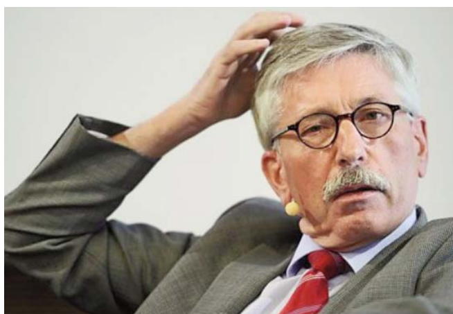
Thilo Sarrazin en el centro de una tormenta política.

En el contexto del espacio urbano actual dentro de un estado democrático, no puede ser el proyecto de un cosmopolitismo elitista desde arriba sino más bien un cosmopolitismo desde abajo . Stuart Hall habla de esto último y utiliza el concepto de cosmopolitismo vernáculo , que se deriva de la experiencia cotidiana de