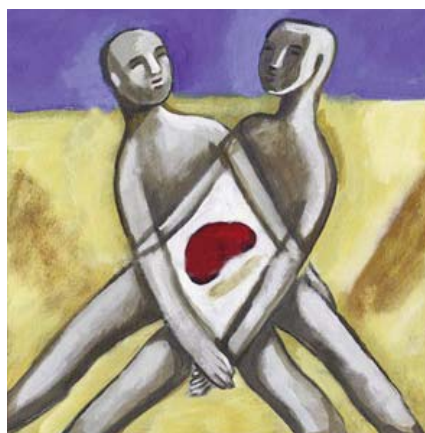
Transplantes de órganos. Un símbolo de cosmopolitización.

En nombre del capitalismo neoliberal y del derecho básico democrático a la elección ilimitada, los valores fundamentales