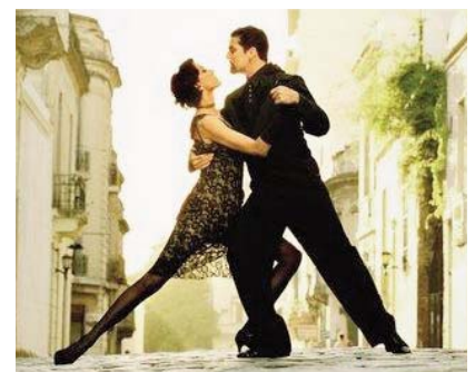
¡Nos vamos a Buenos Aires!

Es un placer anunciar que el Comité Ejecutivo de la ISA ha seleccionado a Buenos Aires, Argentina, para acoger el Forum ISA 2012 (Agosto, 1-4). En aras de la transparencia, el Comité Ejecutivo de la Asociación Internacional de Sociología