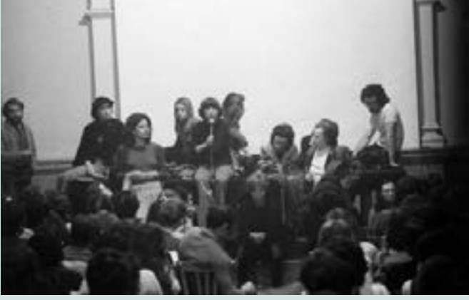
ट्रेंट नारीवादियों की 1968 में बैठक

उभरे। वे महिलाओं के समान अधिकार और गर्भपात एवं तलाक जैसे मुद्दों के इर्दगिर्द राजनैतिक सक्रियतावाद से मजबूती से जुड़े थे। हालांकि राजनैतिक सक्रियतावाद से इस करीबी संपर्क ने अकादमिक व्यवस्था जो अपने आप को राजनैतिक सम्बद्धताओं से स्वतंत्र के रूप में प्रस्तुत करने पर तत्पर थी और समाजशास्त्र, राजनैतिक आतंकवाद एवं आदर्शवादी लक्ष्यों के आरोपों का सामना करने की कोशिश करता एक विषय, में लैंगिक अध्ययनों के संस्थानीकरण को बाधित किया।