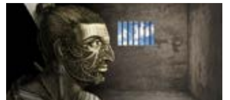
एओतियारोआ से समाजशास्त्री समाज में उनके विभिन्न हस्तक्षेपों के बारे में लिखते हैं।