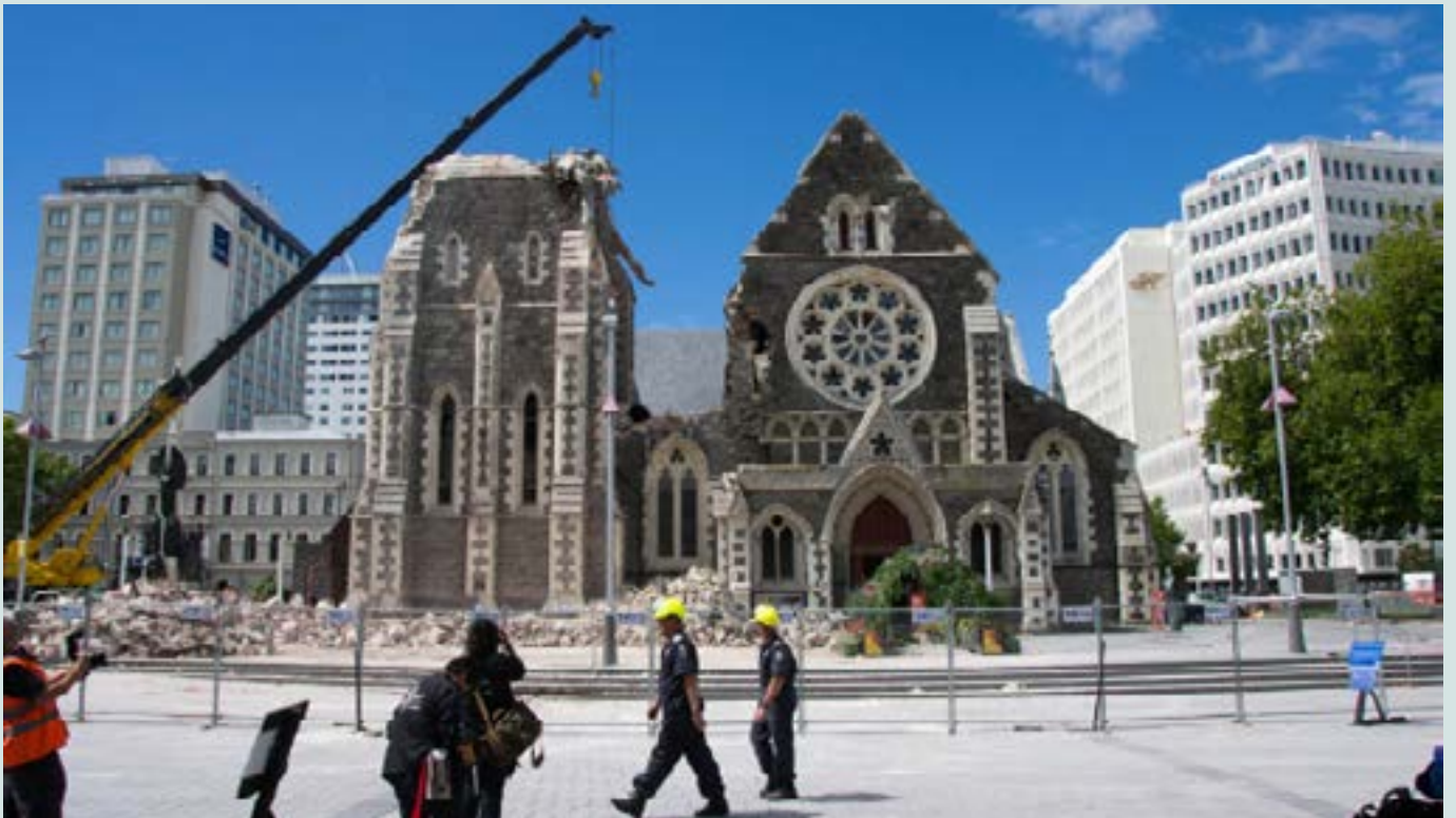
2011 के भूकंप के बाद कैथेड्रल चौक, ओताही (क्राइस्ट चर्च)