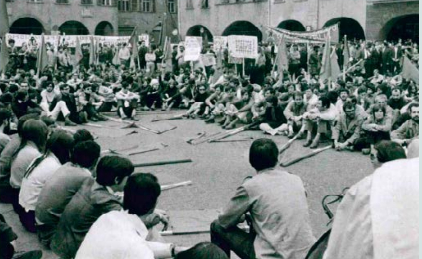
ट्रेन्टो छात्र विद्रोह, 1968