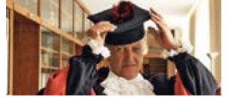
इतालवी समाजशास्त्री इटली में समाजशास्त्र के लिये युद्ध पर चर्चा करते हुए