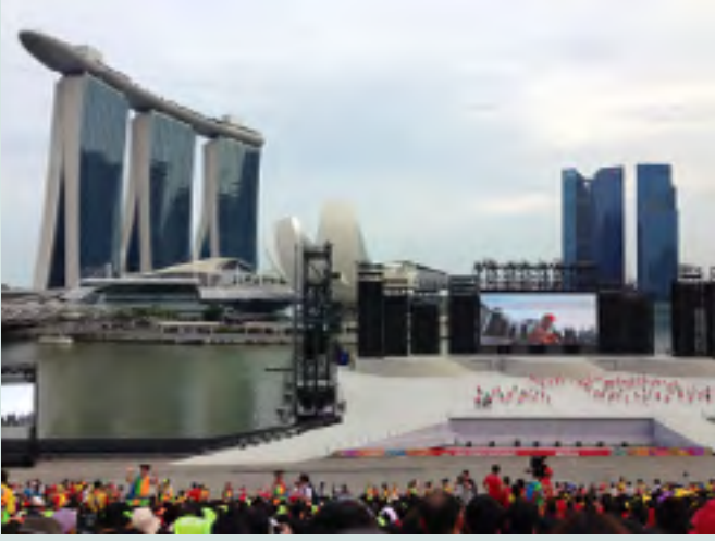
मरीना खाड़ी में राष्ट्रीय दिवस परेड पर तैरते हुए मँव पर पूर्वाभ्यास करते हुए।

डेनियल पी. एस. गोह, राष्ट्रीय विश्वविद्यालय सिंगापुर