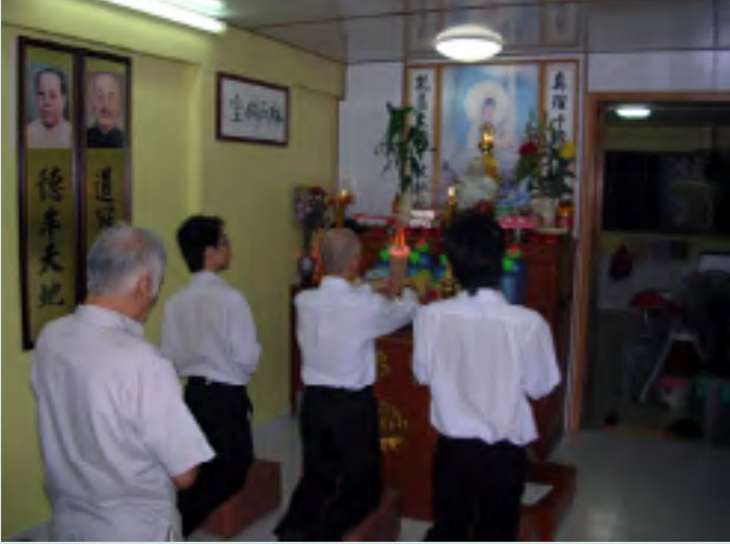
एक सार्वजनिक आवास फ्लैट में गृह मंदिर में श्रद्धालु पूजा करते हुए।

फ्रांसिस खेक गी लिम, ननयाँग प्रौद्योगिकी विश्वविद्यालय, सिंगापुर