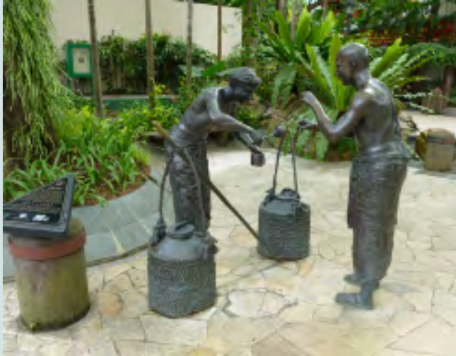
सिंगापुर के वर्तमान कालिक चाइना टाउन जिले के तेलोक अयर ऐतिहासिक स्थल पर मलय और भारतीय व्यापारियों की मूर्ति।