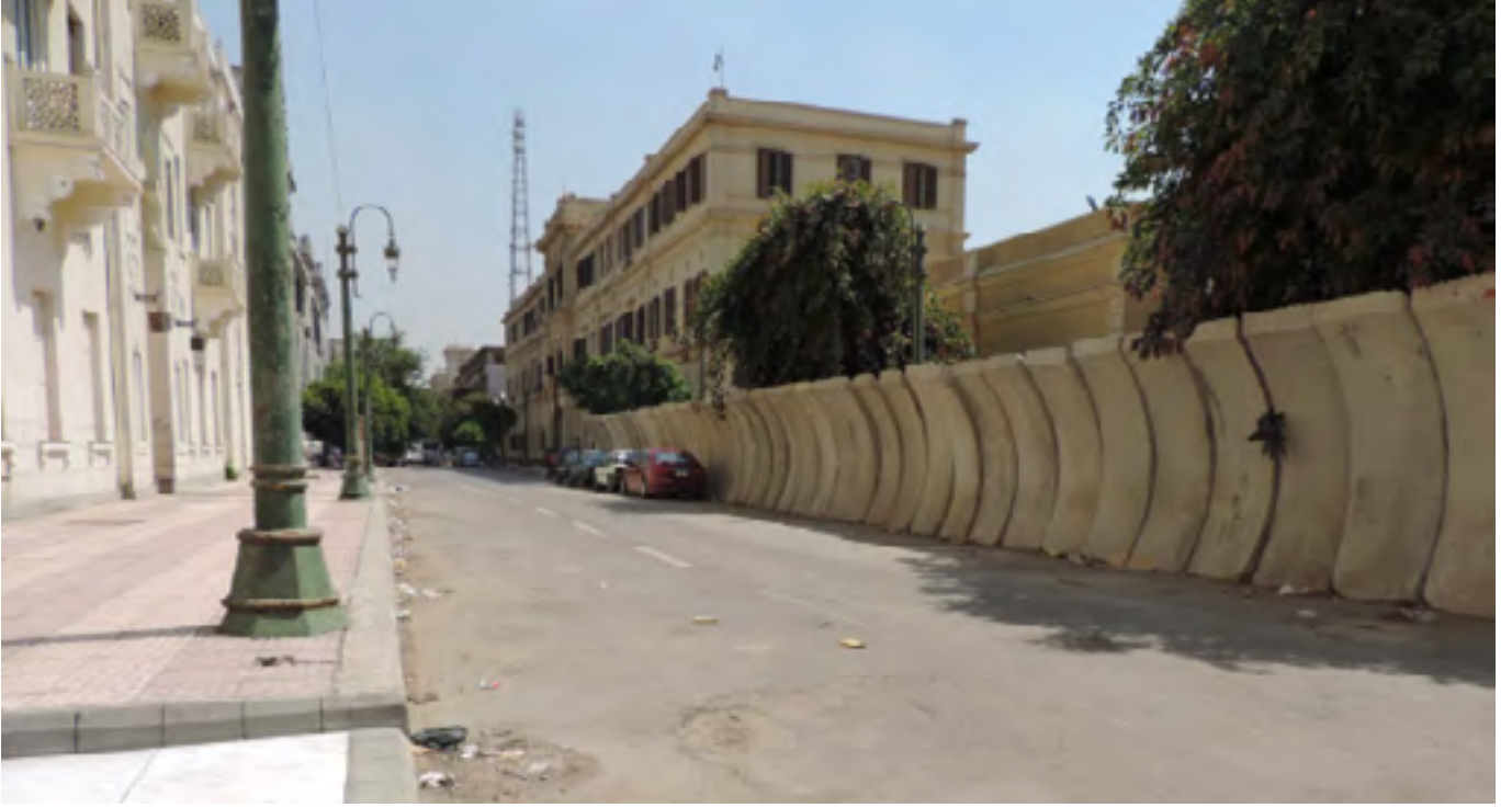
काहिरा में अमरीकी विश्वविद्यालय के प्रवेश द्वार के सामने खड़ी नवनिर्मित अवतल दीवार। सितम्बर 21, 2015

की घोषणा की थी। फिर कैरोबजखर ने हमें सूचित किया कि 2014 में रक्षा मंत्रालय ने UAE में स्थित मेगा कंपनी एम्मार के साथ एक विशाल एम्मार चौक जिसमें अपटाउन काहिरा में सबसे बड़ा शापिंग सेण्टर होगा, के निर्माण का करार किया है। यह दुबई उन्मुख नव उदारवादी बाजार तहरीर चौक को प्रतिरूपित करेगा।