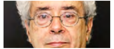
ल्यूक बोलतॉस्की, आलोचना के समाजशास्त्र के महान फ्रेंच सिद्धान्तकार, जासूसी उपन्यासों और समाजशास्त्र के लिए उनकी महत्ता पर उनकी नवीनतम पुस्तक पर बात करते हुए