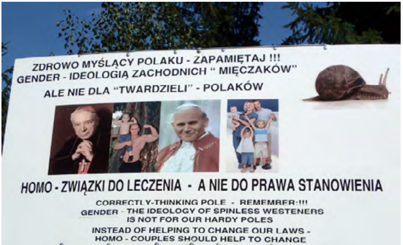
लिंग-विरोधी रैली में एक बैनर, अगस्त 30, 2015।

एग्निज्का ग्राफ, वारसॉ विश्वविद्यालय, पोलेण्ड एवं एल्जबियता कोरोच्चुक, सोडरटोन विश्वविद्यालय, स्वीडन एवं महिलाओं एवं समाज (RC 32) और सामाजिक वर्ग एवं सामाजिक आंदोलन (RC 47) पर आई. एस. ए. की शोध समिति के सदस्य