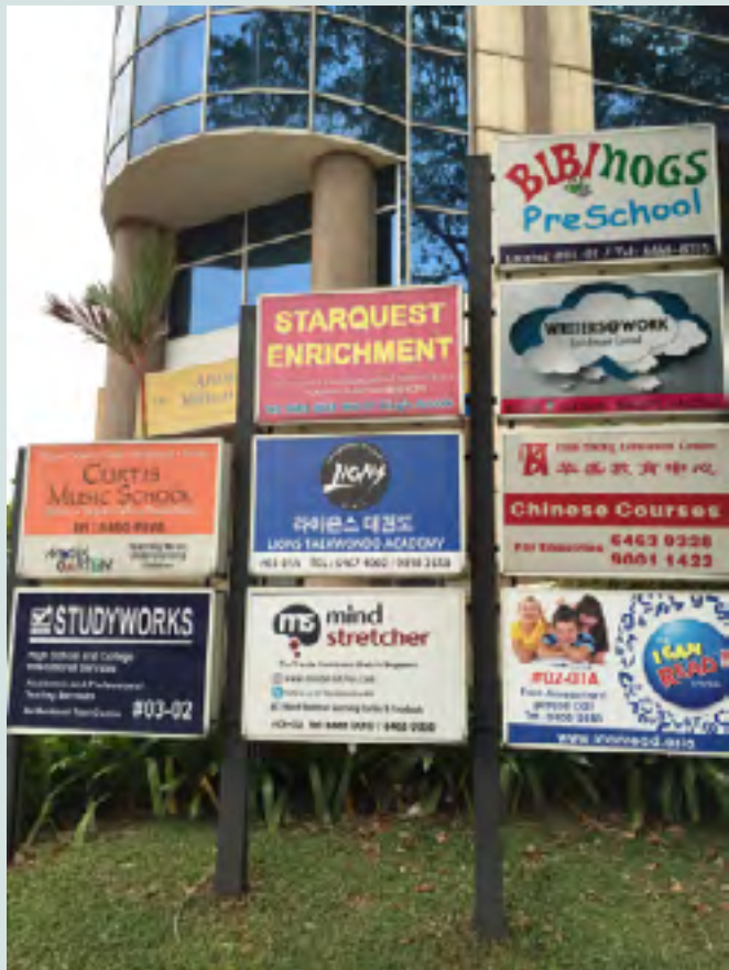
समकालीन सिंगापुर में "संवर्धन" और "ट्यूशन" केन्द्र आज आम रूप से दिखाई देते हैं; यूवेन तियो द्वारा फोटो।

यूवेन तियो, नानयांग प्रौद्योगिकी विश्वविद्यालय, सिंगापुर