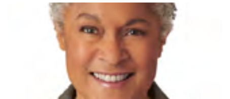
पेट्रीशिया हिल कोलिन्स, अग्रणी अफ्रीकी-अमरीकी नारीवादी बुद्धिजन एवं सीमान्तता पर अपने मौलिक विचार साझा करते हुए।