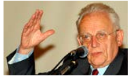
एलेन तौरन , अन्तर्राष्ट्रीय ख्यातिप्राप्त समाजशास्त्री, अपने नये-रास्ते बनाने वाले सिद्धान्तों की उत्पत्ति और अपने नवाचारों तथा सामाजिक आन्दोलनों में अब विस्तृत रूप से उपयोग में ली जाने वाली पद्धति का विवरण दे रहे हैं। यहां वह अपने प्रारम्भिक आशावाद और अभी हाल ही के निराशावाद पर चिन्तन कर रहे हैं।