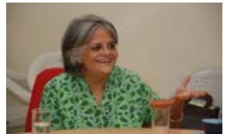
कल्पना कन्नाबिरन भारत की अतिनिपुण समाजशास्त्री एवं सक्रिय कार्यकर्ता, सामाजिक न्याय की खोज में समाजशास्त्र तथा आलोचनात्मक कानूनी अध्ययनों के मध्य संभावित सहजीवन का सम्बन्ध वर्णित कर रही है।