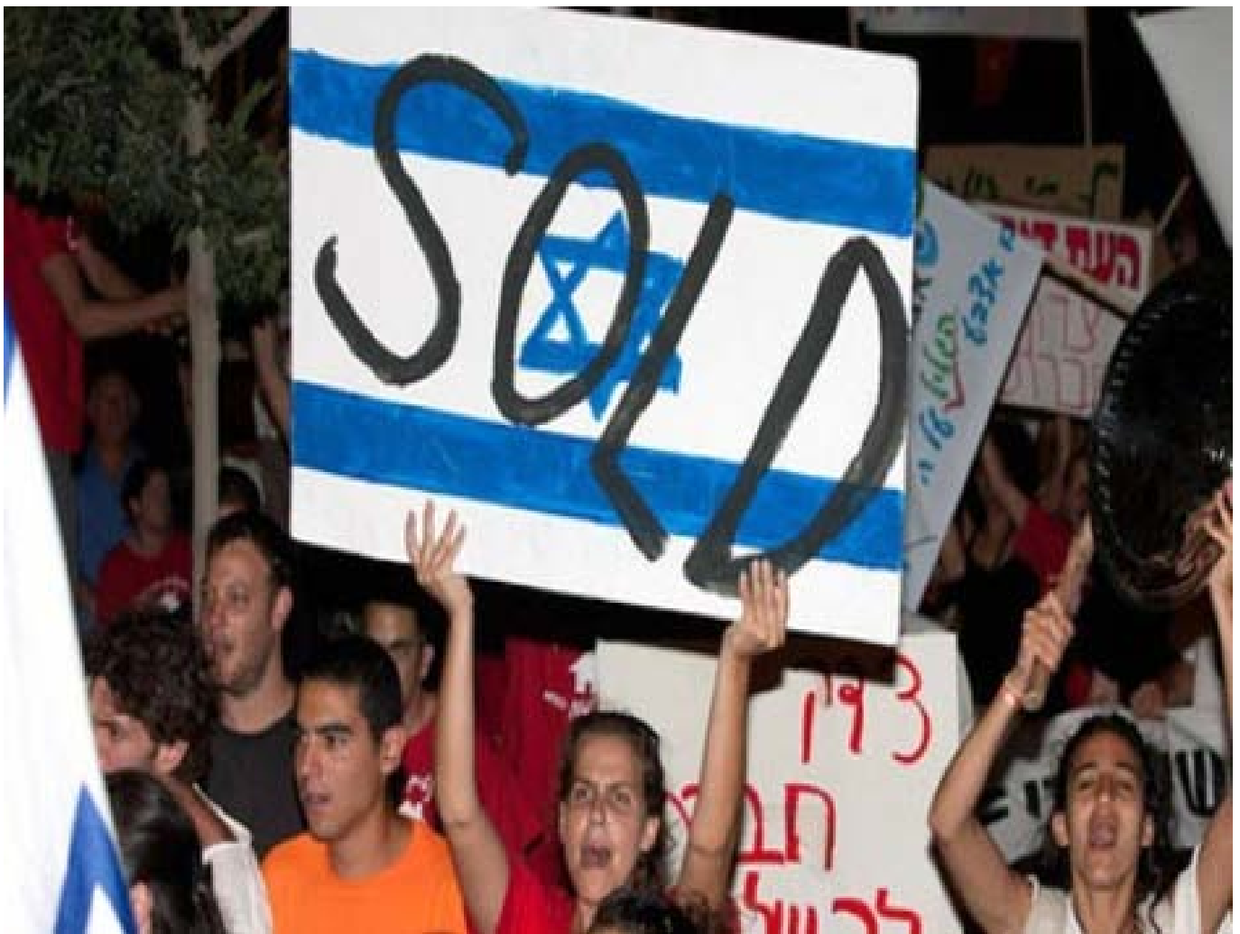
Летние протесты против маркетизации в Израиле.