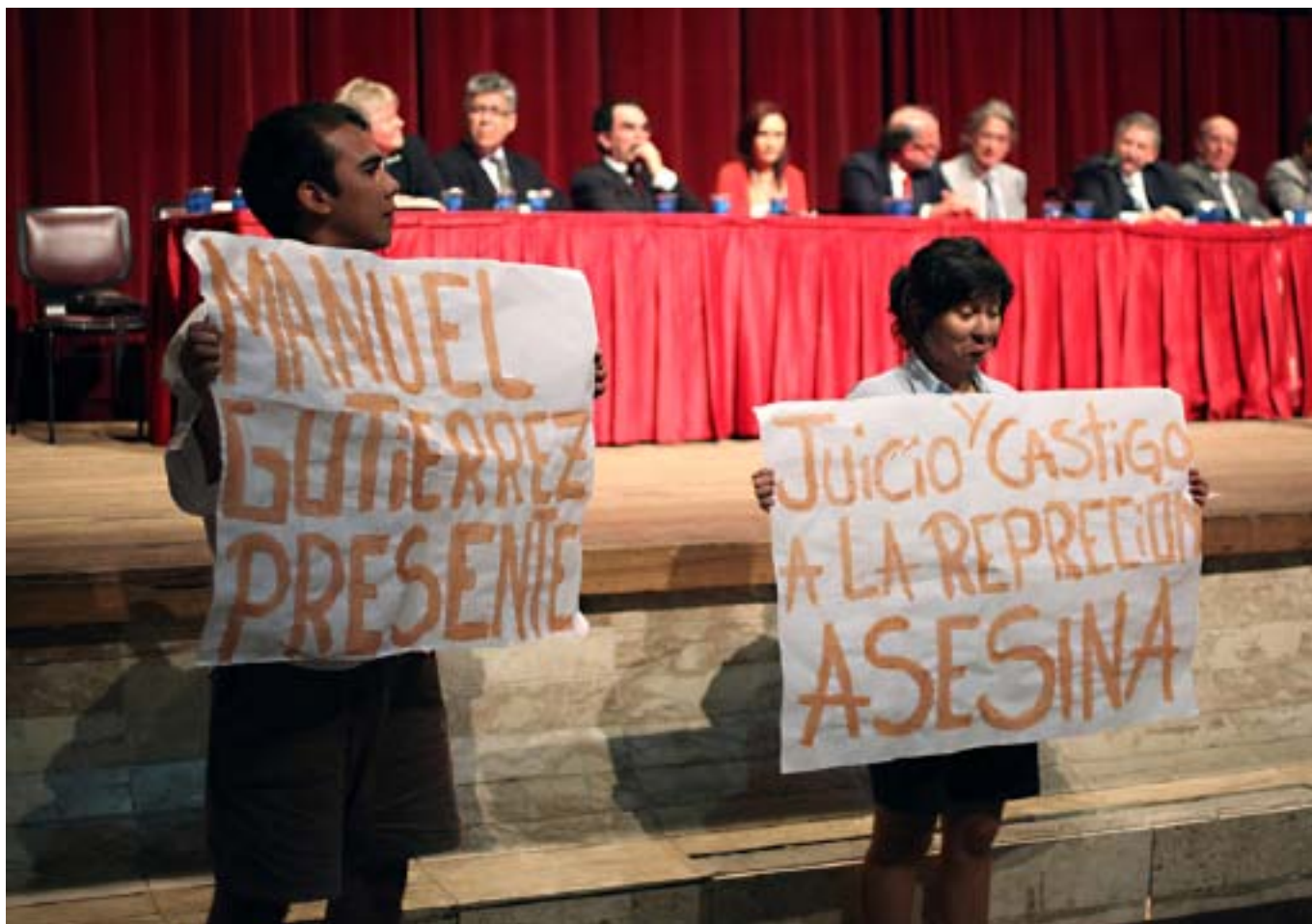
Пикет чилийских студентов на Конгрессе Латиноамериканской социологической ассоциации, сентябрь, 2011.