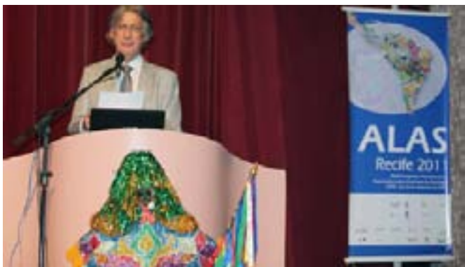
Пауло Энрике Мартинс, президент Латиноамериканской социологической ассоциации на конгрессе в Ресифе, сентябрь, 2011.

восстановлении справедливости и прекращении того, что теперь может быть названо геноцидом; постоянную боль, связанную с уничтожением и непростительно медленной реконструкцией Гаити; опасность восстановления режима преступниками, совершившими геноцид в Гватемале; угрозы новой тирании в Гондурасе, продолжение печально известной экономической блокады, угрожающей свободе кубинского народа в течение последние пятидесяти лет; существование иностранных военных баз на территории Кубы, Колумбии и Пуэрто-Рико. С другой стороны, мы видим примеры альтернативного развития, которые доказывают, что у нас есть память и сила для преодоления трудностей: Бразилия, Эквадор, Боливия, Венесуэла, Уругвай, Парагвай, Аргентина, конечно, Куба и с недавних пор Перу открыли путь надежды для нашего народа, осознающего серьезные проблемы, препятствующие будущему миллионов людей в нашем великом регионе.