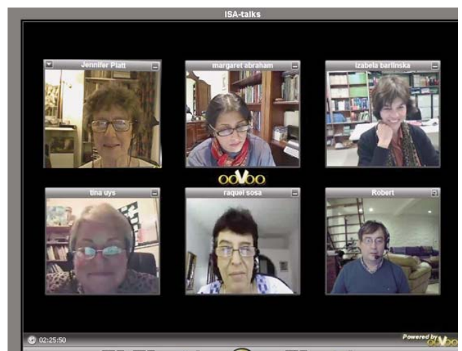
Vicepresidentes de la ISA construyendo una sociología mundial en ooVoo, lo más reciente en comunicaciones en línea.

Para las ciencias sociales, algunas de las más poderosas fuerzas alternativas al pensamiento metropolitano son aquellas