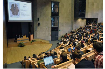
Sesión inaugural de la Sociedad Polaca de Sociología, Cracovia.

Desafortunadamente, durante el período estalinista después de la Segunda Guerra Mundial, en Polonia la sociología se declaró ciencia “burguesa” en 1951. Todos los departamentos de sociología e institutos de las universidades se cerraron. Una vez readmitida en la vida académica de Polonia a partir de 1956, un