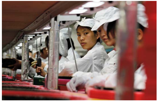
Trabajadores y trabajadoras de Foxconn.

El grupo taiwanés Foxconn Technology Group es el fabricante de electrónica por contrato más grande del mundo, abarcando más del 50% de la fabricación global de electrónica y del ingreso de la industria de servicios. Foxconn opera con más de 40 instalaciones de fabricación y centros de Investigación y Desarrollo en Asia, Rusia, Europa y las Américas. Sus ingresos acumulados desde enero a septiembre de 2010 alcanzaron 1.95 trillones de $ NT (60.82 billones de $ USA), casi con un aumento del 63% respecto al año anterior, mayor al de algunas de las empresas para las que fabrica productos como Microsoft y Nokia según el ranking de compañías Global Fortune 500 . Con el enorme gasto del gobierno y el rápido crecimiento de la demanda de consumo de electrónica, la economía de exportación de China se está recuperando rápido de la reciente crisis financiera. Pero, ¿es la estrategia de competitividad china de bajo coste, supresora de los derechos laborales, económicamente sostenible y moralmente aceptable? En el 'taller de electrónica del mundo', a inicios de este año, 17 intentos de suicidios de trabajadores han tenido lugar en las fábricas de Foxconn en China. Esta tragedia ha llevado a 13 muertes y 4 lesiones, todas ellas de trabajadores migrantes externos de entre 17 y 25 años, en la flor de la juventud. Su pérdida debe despertar la reflexión a la sociedad china e internacional sobre los costes de un mode-