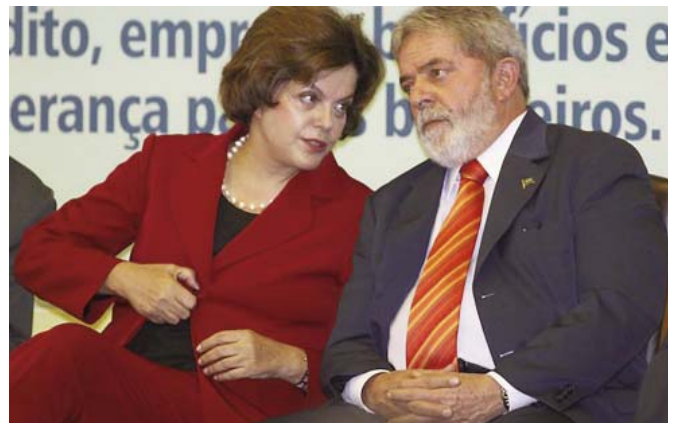
Transmitiendo el Lulismo: la nueva presidenta consulta a su predecesor.

¿Qué es exactamente este Lulismo y de dónde vino? En Brasil, los años 90 fueron una década de reestructuración de la producción empresarial, privatizaciones y crisis de la militancia sindical.