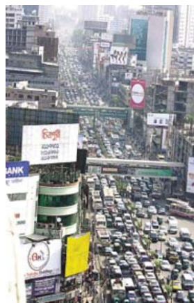
Dhaka - La megaciudad.

Históricamente, la urbanización fue el resultado de la industrialización. En el mundo en desarrollo, la urbanización sin una industrialización generadora de empleo o incluso el trabajo informal es a menudo la norma, provocando una concentración de los pobres. De la población estimada de Dhaka de 15 millo-