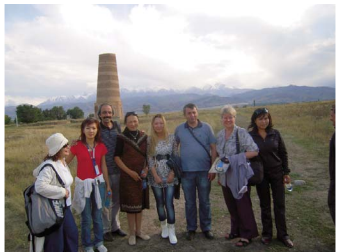
Sociólogos y sociólogas haciendo senderismo en las montañas de Kirguistán